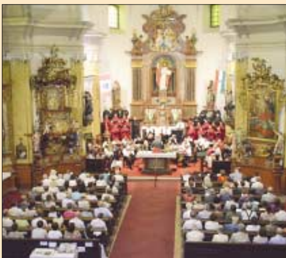
Haydn: Nelson miséje csendült fel a Szent Péter és Pál Főplébánia-templomban a búcsú másnapján