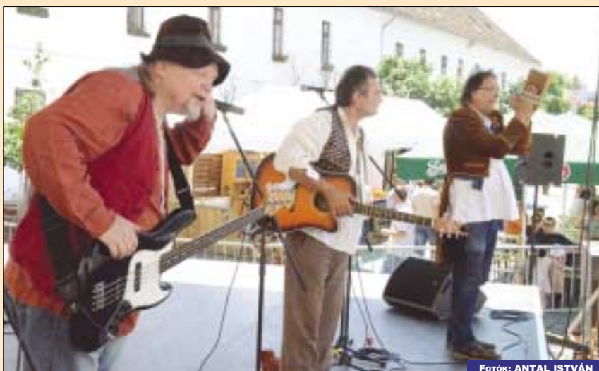
A Holló Együttes megkacagtatta a gyermekeket