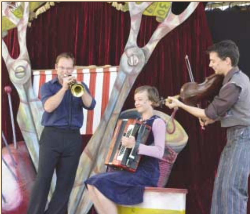
A Mesebólt Bábszínház „A Vitéz szabólegényt” adta elő