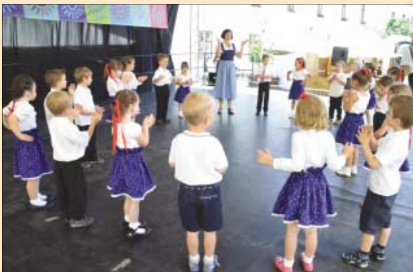
Az óvodások sem maradtak ki a sorból; ők is részt vesznek a német nemzetiségi oktatási programban