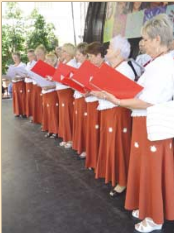
A Szent Kinga Lengyel Kórus