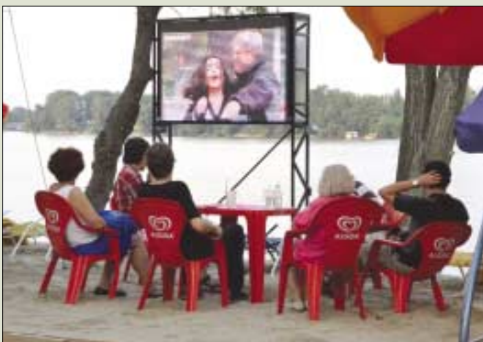
Homokos plázs a Római-parton

Kérünk mindenkit, hogy segítse a kerület tisztán tartását, a minket körülvevő lakókörnyezetünk gondozását, rendbetételét! Óbuda-Békásmegyér Önkormányzata