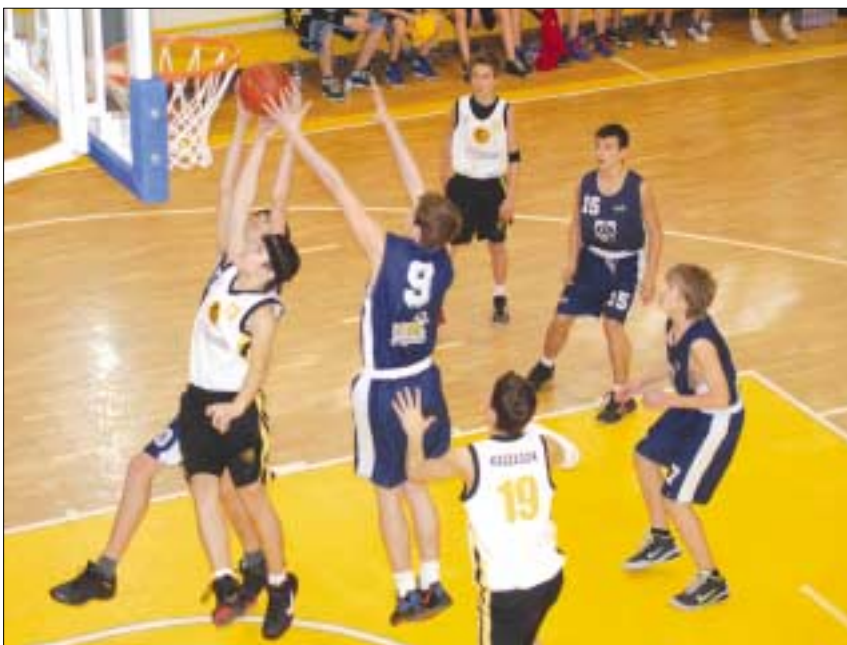
A sok Kaszás (fehér mezben) kosár egyike a Kárpátia kupán

Az elmúlt évben ez a gárda nagy igyekezete ellenére sem tudta kiharcolni az országos döntőbe kerülést. Amikor a csapat megkezdte az alapozást, az egyesület tudatosította a játékosokban és a szülőkben, hogy csak egy cél vezérelhet mindenkit: a döntőbe jutás. Zaklatott volt az indulás, sérülések és betegségek nehezítették a felkészülést. A folytatásban már érződött, hogy reális lehet a célkitűzés. Sorra jöttek a győzelmek, a Vasas és a Szolnok elleni siker hatásos doppingnak minősült. A végén simán bejutottak a döntőbe, ahol a harmadik helyért vívott mérkőzésen 81:69-re kikaptak a Sze-