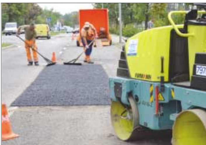
Aszfaltszőnyegezés a Záhony utcában