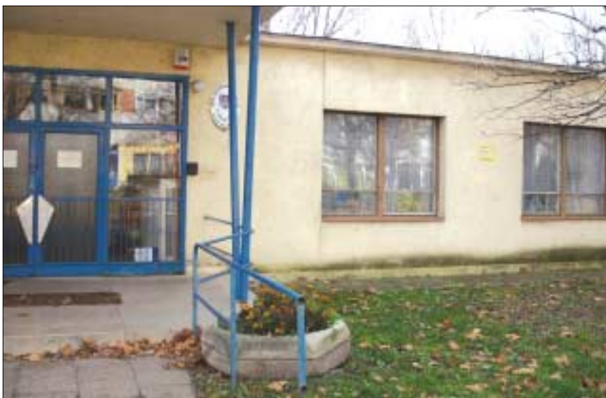
Ilyen volt, ilyen lett

Nyáron igényes munkával két hét alatt elkészült a felújítás, mely ráadásra is „gyermekbaráttá” változtatta a többnyire Macis oviként emlegetett óvodát, kicsik és nagyok öröme.