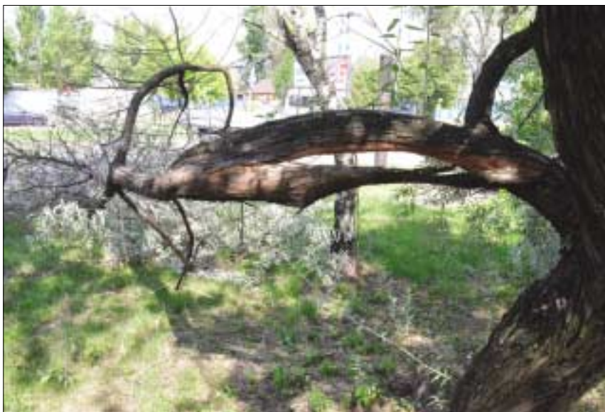
A kánikulát kísérő, követő félelmetes viharok a növényeket sem kímélték: ezt a fát a Huszti úton törte derékba az óriási erejű szél

A textilhulladékok szelektív gyűjtése általában nem megoldott, mivel ezen anyagok újrafeldolgozása hazánkban még nem terjedt el. A két legnagyobb hazai feldolgozó a Temaforg és a Tesa Kft. Ezek a cégek a felvásárolt hulladékból fonalat és ipari vattát állítanak elő. Ha még használható ruháktól, ágyneműtől szeretnénk megszabadítani otthonunkat, szívesen fogadják azt a rászorulókat, illetve több karitatív szervezetnek is fel lehet ajánlani. A nagyobb áruházak parkolójában található konténerben is elhelyezhetők a számunkra már használhatatlan ruhadarabok. De örömmel átvesszük a jó nedvszívó képességű textíliákat a kisebb-nagyobb üzemek, műhelyek, ahol géprongynak remekül tudják hasznosítani.