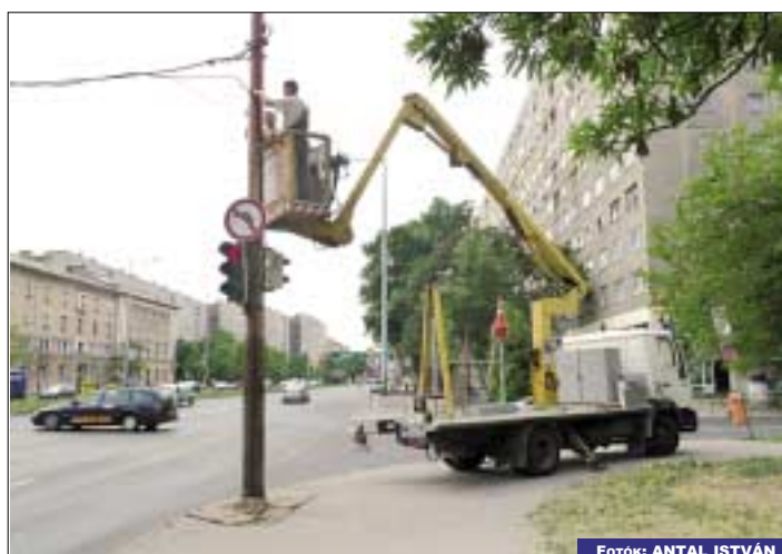
Újrafestették az ostorlámpákat a Szentendrei út mentén