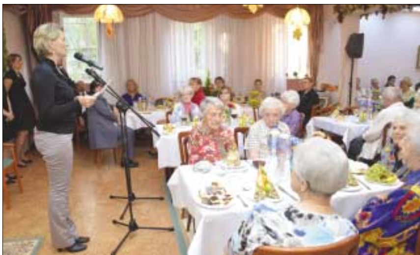
Az Idősek Világnapja alkalmából helyi ünnepeket rendezett az Óbudai Szociális Szolgáltató Intézmény október 2-a és 18-a között a városrész kilenc idősek klubjában. A Derűs Alkony Gondozóházban Kelemen Viktória alpolgármester köszöntötte a nyugdíjasokat