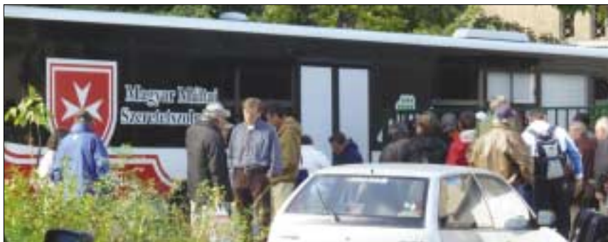
Bárki megvizsgálthatta magát a Magyar Máltai Szeretetszolgálat tüdőszűrő autóbusszában, mely a Miklós utcában parkolt