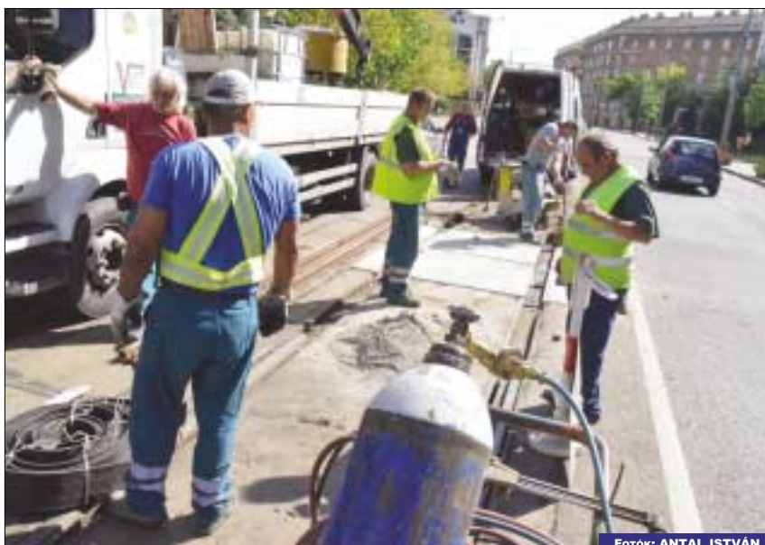
Az elöregedett sántartókat cserélik a 17-es villamos vonalán, a Bécsi úton

A július 1-jével indított, menetrend szerinti dunai hajózás hamar népszerűvé vált az utasok körében. Az eddigi mérések szerint havi átlagban mintegy 140 ezren vették igénybe a D11-es, a D12-es és a D13-as hajójáratokat. (A hajójáratok pontos menetrendjéről a www.bkk.hu oldalon és a megállóhelyeken található hirdetőpanelekkel tájékozódhatnak az utasok.)