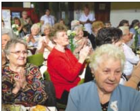
HATVANY UTCAI IDŐSEK KLUBJA

A bőrgyógyászat csak előjegyzéssel fogad betegeket novembertől a Vörösvári úti járóbeteg-szakrendelőben. Időpont kérhető a 388-8384-es, 388-7760-as telefonszámokon vagy az elojegyzes@obudairendelok.hu e-mail címen. A változás nem érinti a Csobánka téri bőrgyógyászati szakrendelést.