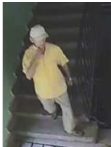
Összeállította Szeberényi Csilla

látható személyt felismeri vagy a bűncselekményről érdemleges információval rendelkezik, hívja a 430-4700/118-es telefonszámot, illetve névtelensége mellett tegyen bejelentést az ingyenes 06-80-555-111-es „Telefontanú” zöldszámán.