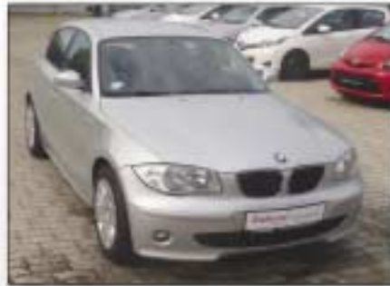
BMW 120d Automata 2006/03 2 490 000 Ft