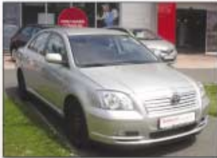
Toyota Avensis 1,6 2004/04 1 390 000 Ft