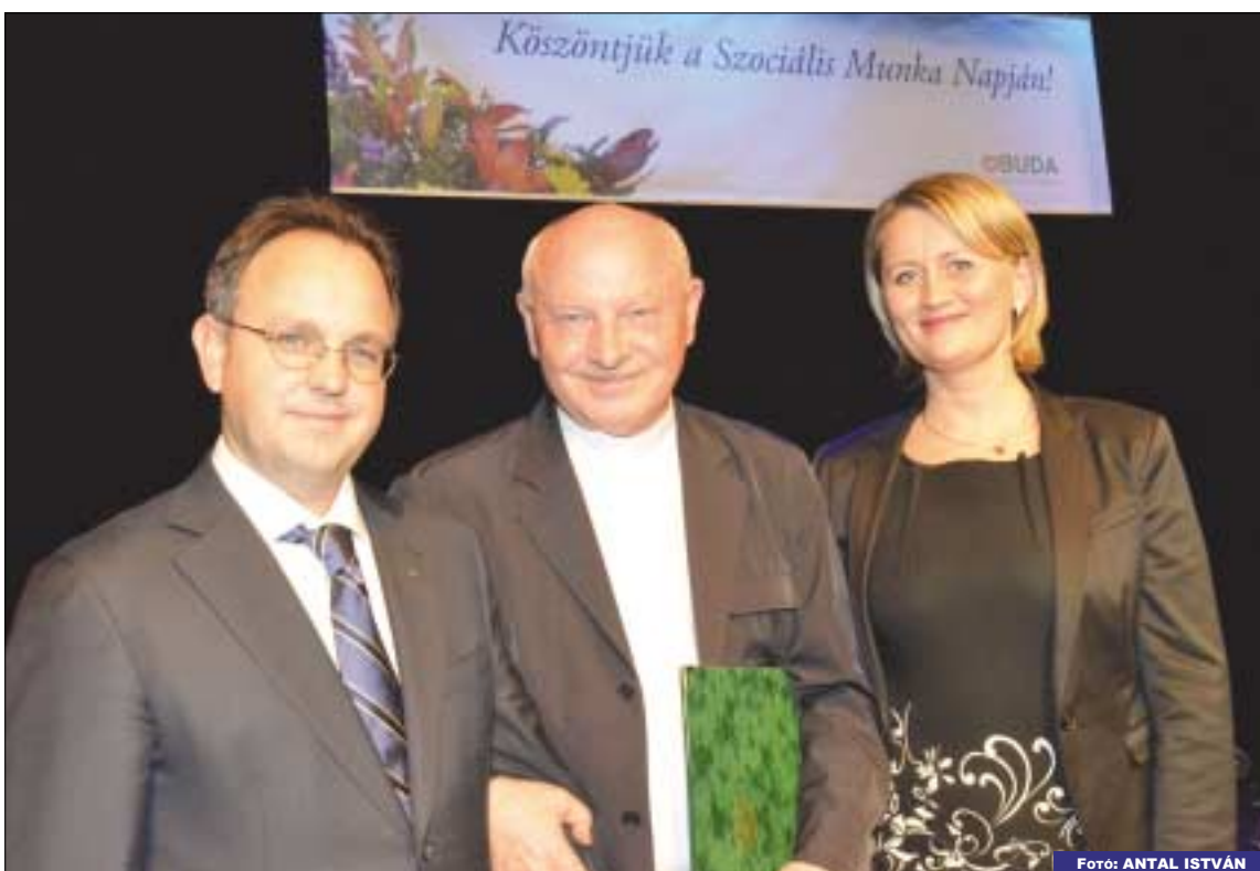
Bús Balázs polgármester, Kozma Imre atya és Kelemen Viktória alpolgármester a Szociális Munka Napja alkalmából rendezett ünnepségen az Óbudai Kulturális Központban

Óbuda-Békásmegyer Önkormányzata több mint 10 éve köszönti a szociális területen dolgozókat a Szociális Munka Napján.