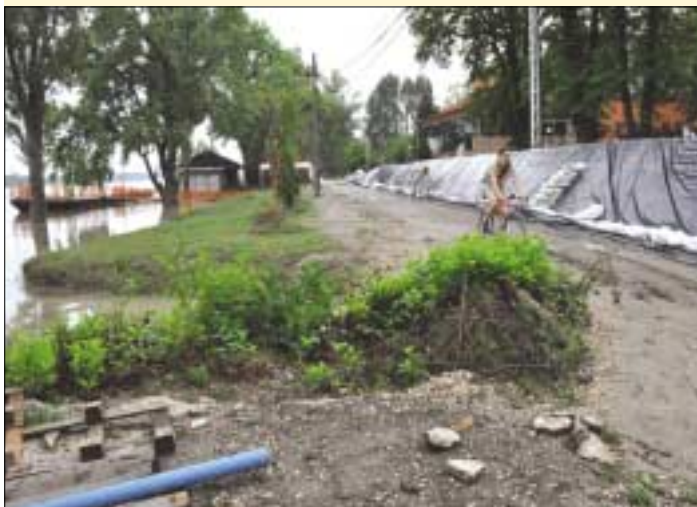
Hosszú évek óta várnak a Római-parton és környékén élők a védműre

elmondta: a római-parti védmű megépítése Tarlós István főpolgármester számára a legfontosabb projektek közé tartozik, több évtizedes adósságot törleszt a megépítésével. A kivitelezés jövő tavasszal kezdődhet, 2014 második felében állhat a gát. Szeberényi Cs.