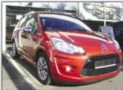
Citroën C3 1,4 Chic 3430 km-rell 2012/05 2 989 999 Ft