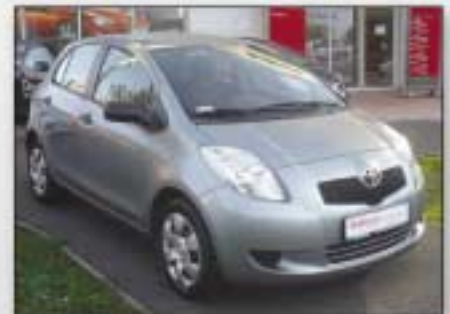
Toyota Yaris 1,3 Terra 2007/10 1 790 000 Ft