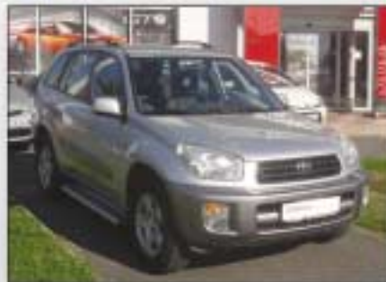
Toyota Rav4 2,0 4x4 2003/04 2 190 000 Ft