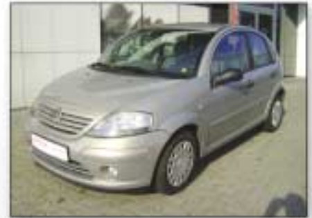
Citroën C3 1,4 HDi SX 2004/01 979 000 Ft