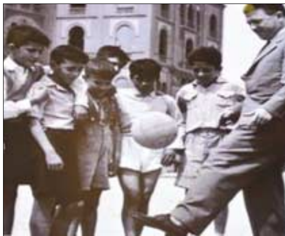
A kép alapján készülhet a szobor. A felvétel Puskást örökíti meg, miközben Szalonikiben gyerekeket tanít dekázni

A sajtótájékoztató elhangzott, hogy az Óbuda Újlak Közösségi Egyesület tíz művész számára meghívó pályázatot írt ki a szobor elkészítésére. Az alkotóknak egy fotó