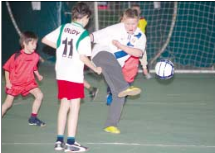
A sátorban télen sincs szünet, edzenek, tornákon vesznek részt a focisták

Nem tartoznak Óbuda ismert sportegyesületei közé. Tizenegy éves fennállásuk alatt speciális tevékenységet folytatnak: tömegsport szinten „kínálják” a mozgást, a szabadidő hasznos eltöltésében nyújtanak segítséget a kerület lakosainak. A Csillaghegyi Mozgás és Szabadidő (CSMSZ) Sportegyesület gazdag programjával egyre hatékonyabbá válik, évek múltán kinőheti magát a „kis egyesület” kategóriából.