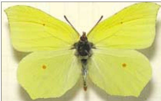
Összeállította Domi Zsuzsa

Kétheti bábállapot után pedig - nagyjából június végén - kikelnek az új nemzedék lepkéi, és ezeket szeptember végéig láthatjuk a virágok körül, bár a legforróbb hetekre eltűnnek, hogy sziklahasadékokban, faodvakban, pincékben hűsöljenek. Ősszel ismét megjelennek, majd telelőhelyükre vonulnak. Sok más lepke is telel imágó alakban, de általában zártabb helyen; a citromlepke azonban megelégszik a borostyán vagy a szeder télen is zöld, összeboruló levél-sátrával, mi több, néha csak a bokrok ágaira kapaszkodik. Testfolyadék úgy hűl le, hogy szövetei fagypontra alatta sem károsodnak. Tavasszal azután ismét láthatjuk a lepkéket, bár csak rövid ideig, mert párzás és peterakás után elpusztulnak. A hazai nappali lepkék között a leghosszabb életű, lepkéként akár a 10 hónapos kort is megéri.