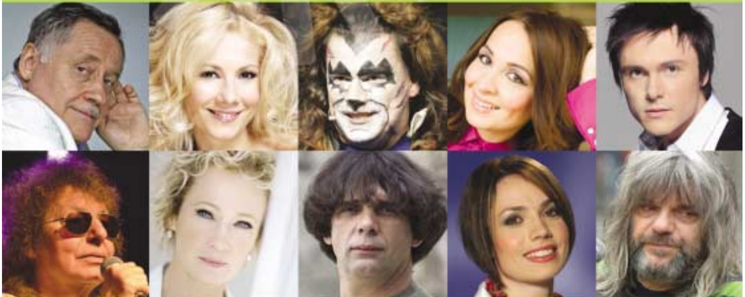
Bús Balázs polgármester

Kodály szavaival várom Önt, ismerőseit és barátait is a nyári hónapokban arra a kalandozásra, mely során fiatalok és idősebbek együtt válhatnak az Óbudai Nyár kultúraápoló és terjesztő küldetésének részesévé.