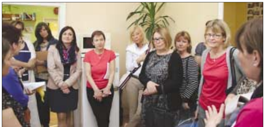
SVÉD VÉDŐNŐK ÓBUDÁN. Stockholm Farsta nevű városrészének védőnői látogatást tettek a Szent Margit Rendelőintézetben. A svéd vendégek megismerkedtek a szakrendelővel, illetve Óbuda-Békásmegyer Védőnői Szolgálatának működésével