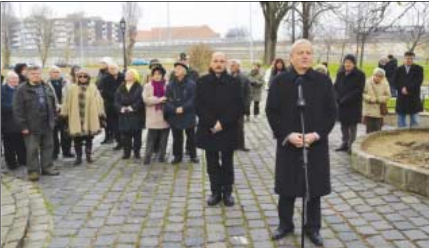
Az óbudai főplébánia-templom és a hozzá tartozó műemlékek korszerű díszkivilágítást kaptak nemrégiben a fővárosnak köszönhetően.

Egy régi templom nem csak szakrális hely: műemlék, a környék és a település díszé, büszkesége is. Különösen, ha olyan patinás épületről van szó, mint az Óbudai Szent Péter és Pál Főplébánia-templom. A főplébánia honlapja szerint Szent István 1015-ös templomalapító rendelkezése óta folyamatosan állt ezen a helyen (a mai Árpád híd lábánál) vagy közvetlen közelében templom.