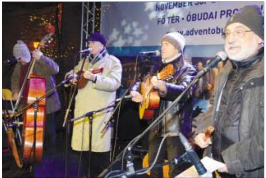
„Szabad-e bejönni ide betlehemmel?” címmel a Kalácsa együttes adventi záró koncertjét hallhatta a közönség tavaly december 22-én a Fő téren