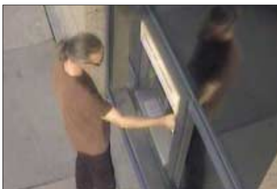
Az oldalt összeállította Szeberényi Csilla

helyéről vagy a bűncselekményről bármilyen információval rendelkezik, hívja a rendőrséget!