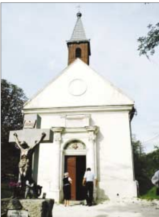
A rovatot összeállította Szeberényi Csilla

határozott, hogy a centenárium alkalmából támogatja a III. kerületi I. világháborús emlékek felmérését, és amennyiben lehetőség van rá a 2014. évi költségvetésben szerepelteti a szükséges kiadásokat.