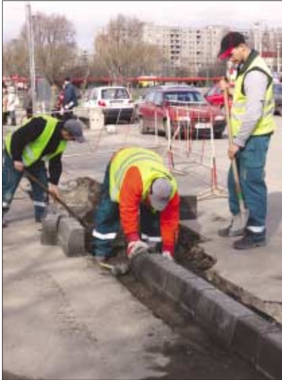
Juhász Gyula utca sarkánál: a Hatvany Lajos utcában a Juhász Gyula utca kereszteződése után.