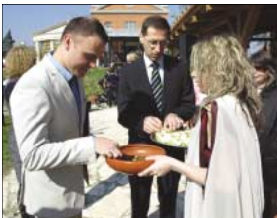
Csepreghy Nándor fejlesztéspolitikai kommunikációért felelős helyettes államtitkár és Varga Mihály nemzetgazdasági miniszter tartott sajtótájékoztatót az európai uniós fejlesztésekről az Aquincumi Múzeumban

E sorban szerepel Óbuda egyik büszkesége, az Aquincumi Múzeum is. Itt egy kéthektáros bővítést sikerült elérni az Európai Unió támogatásával. A múzeum egyik érdekessége a Festőház , amely egy hajdani római lakóház rekonstrukciója, továbbá rengeteg érdek-