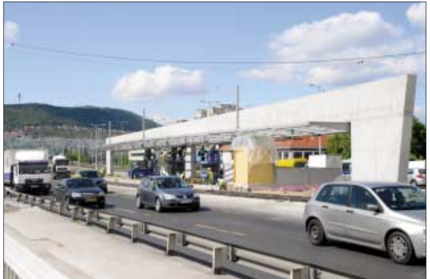
Az 1-es villamos Szentlélek téri megállója. Fedett perontetők épülnek a megállók fölött