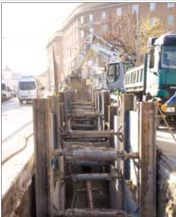
Folytatódik a vízvezeték-csere a Bécsi úton

csúcsidőszakban torlódások alakulhatnak ki a környéken, ezért az arra közlekedők türelmét és megértését kéri a Budapesti Közlekedési Központ.