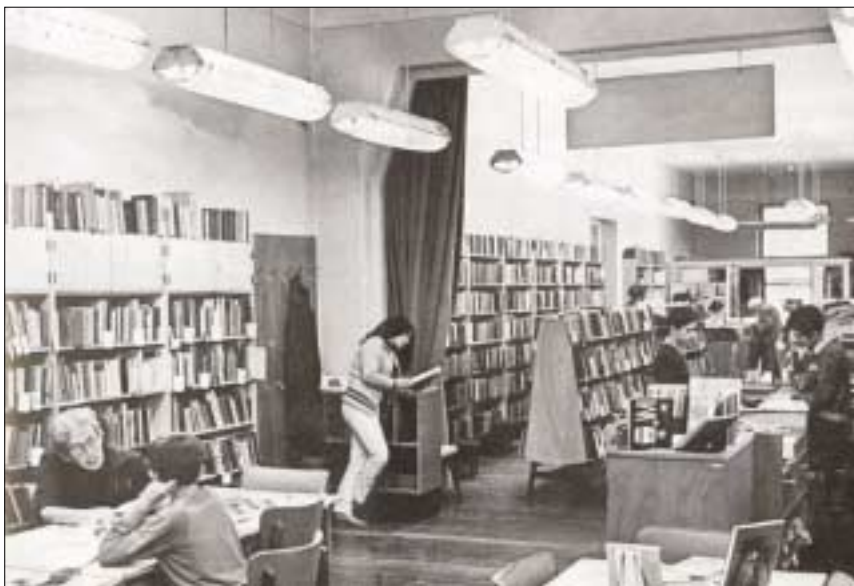
A valamikori csillaghegyi Szabó Ervin könyvtár a Bajáky Elemér utcában