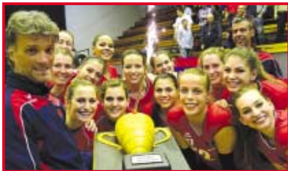
A bajnokcsapat ünnepi tortáját a Cziniel Cukrászda és Kávéházban készítették