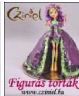
Figurás torták www.czimiel.hu