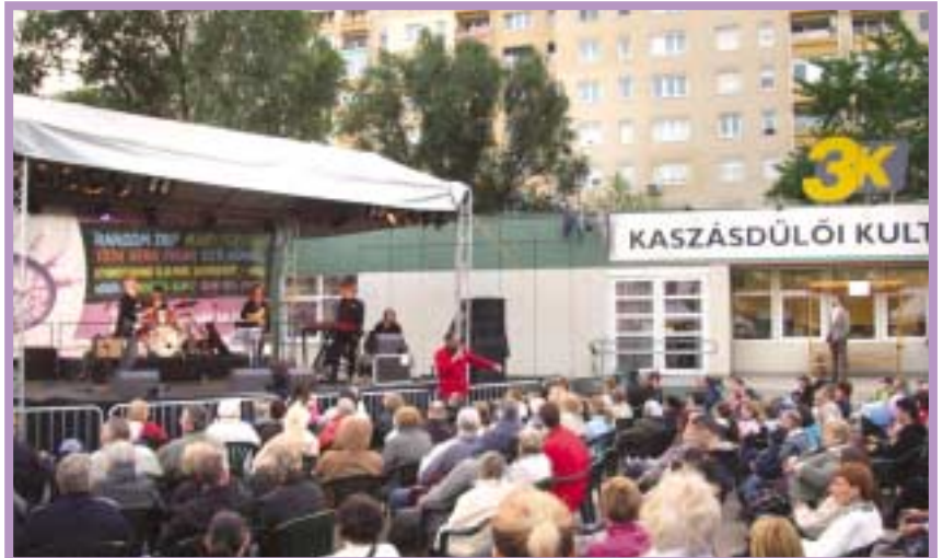
Kaszásdűlő: koncertek, sportbemutatók, bábszínházi előadás, kutyaaidomítás, kézműves foglalkozások, vásárosok színesítették a programot

előadásokkal, kézműves kirakodóvásárral, civil udvarral, közbiztonsági bemutatókkal, sportrendezvényekkel várták az érdeklődőket Csillaghegyen, Békásmegyeren, Ófaluban, Kaszásdűlőn, a 3K előtti Pethe Ferenc téren, Pünkösdfürdőn, a Római-parton, a Krúdy-negyedben, a Gázgyári lakótelepen, Aquincum-Mocsárosban, Péterhegyen, Csúcshegyen. Képes összeállításunkban pillanatfelvételeket adunk közre a kerület egyik legjelentősebb eseményéről, az Óbuda Napjáról.