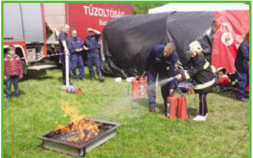
Közbiztonsági nap a Csobánka téren