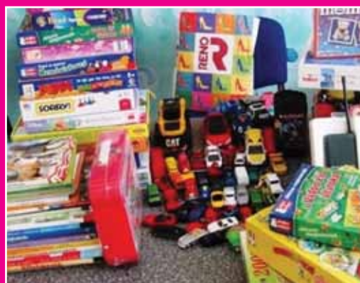
A tavaly felajánlott játékok gyűjteménye

A gyermeknap alkalmából, május 28-án az Óbudai Családi Tanácsadó és Gyermekvédelmi Központ az Összefogás Óbudáért Egyesülettel és az Étel az Életért Alapítvánnyal közösen, ételosztással összekötve szeretné megajándékozni a rászoruló III. kerületi gyermekeket. Ezért arra kérjük a tisztelt kerületi lakosokat, hogy a már nem használt, de még jó állapotban lévő gyermekjátékokat, társasjátékokat és könyveket hozzák el adományként az intézmény Váradai utca 9-11. szám alatti telephelyére, 2016. május 27-ig nyitva tartási időben. Hétfő: 13-18-ig, kedd, szerda, csütörtök: 9-18-ig, péntek: 9-12.30-ig. Az intézmény telefonszáma: 250-1964. Minden felajánlást szívesen fogadunk!