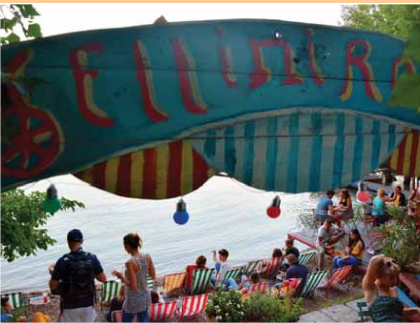
Ez a hely még Fellininek is tetszene. Nyári délután a Római-parton