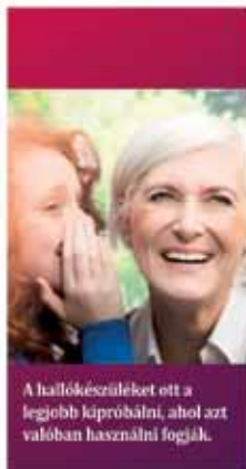
A hallókészüléket ott a legjobb kipróbálni, ahol azt valóban használni fogják.

- Az úgynevezett próbahordás egy remek lehetőség, amit azért is támogatok, mert a hallókészüléket ott a legjobb kipróbálni, ahol azt valóban használni fogják: otthoni, munkahelyi környezetben vagy baráti társaságban. Nem is lehet szakmailag megalapo-