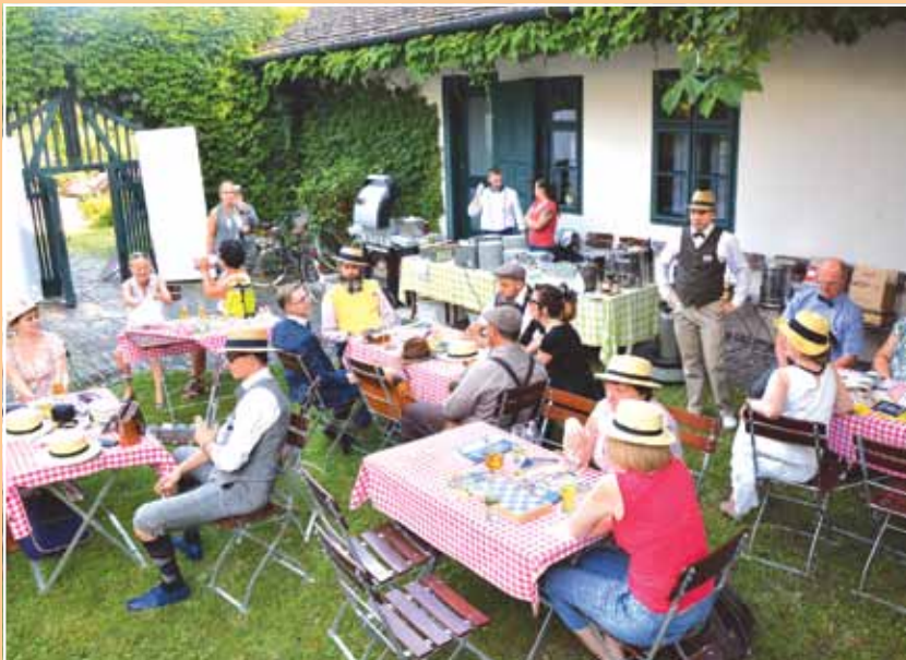
Kockás abrosz, jó kadarka mellett... – jelmezes időutazás az Óbudai Társaskör hangulatos kertjében