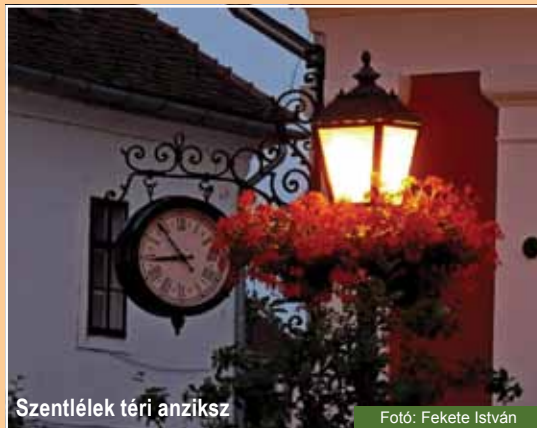
Szentlélek téri anziksz