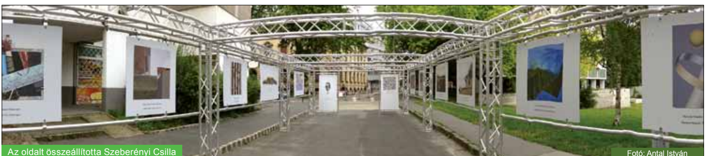
Az oldalt összeállította Szeberényi Csilla

A sZemPöl Offchestra Csikszeredáról érkezett, hogy ingyenes koncertet adjon a Zichy-udvarban az Óbudai Nyár programjában július 30-án. Zenéjük egyik fő eleme a játékoság és a teatralitás. Nincs két egyforma hangzás, szabadon kalandoznak a stílusok között. A csapatban két vj (video jockey) is helyet kapott, akik élő vetítéseket illetve mappinget használnak, ezáltal audiovizuális eseménnyé alakítják a koncerteket. Zenei világuk elektronikai alapokra épülő örületet kever – egyedi műfajmeghatározásuk a balkan-teatro-disco