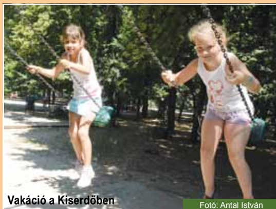
Vakáció a Kiserdőben