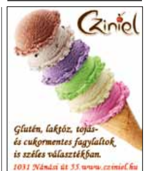
Giniel Glutén, laktóz, tojás- és cukormentes fagyalok, is széles választékban. 1031 Nánási út 55 www.giniel.hu

A Nagy-Hárs-hegyen található, 1980-as években átadott Kaán Károly-kilátó rekonstrukciós és szerkezet-megerősítő folyamaton esett át. A felújítási munkálatok befejeződtek, a kilátó ismét látogatható. A tetőt fedő régi deszkákat a szakemberek eltávolították, helyükre egy új, komolyabb vízszigetelő réteggel ellátott zsindeletet került. A kilátót alkotó többi faszervezeti egységeket (korlátokat, lépcsőket, padlózatokat) felcsiszolták, újrafestették. A felújítás 2,5 millió forintot magánadományból valósult meg. Ősszel az erdészet új pihenőhelyet létesít a Nagy-Hárs-hegyen.