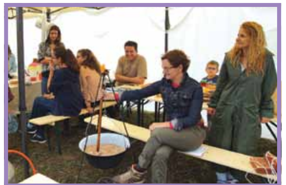
A Mészkö Parkban kombinálták a pikniket a főzőversennyel

Piknik Békásmegyér-Ófaluban családoknak gyermekekkel