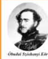
Óbudai Széchenyi Kör