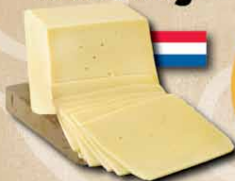
Eredeti holland Edami sajt 1199 ft/kg