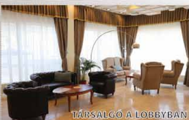
TÁRSALGÓ A LOBBYBAN

Segítünk megkeresni azt a tevékenységet, ami a mindennapi örömet biztosítja lakóink számára, így kipróbálhatják például a festést, ékszerkészítést, tarthatnak előadást, élménybeszámolót, stb.