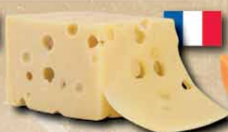
Eredeti francia Emmentáli sajt 1799 ft/kg