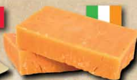
Eredeti ír Cheddar sajt 1799 ft/kg