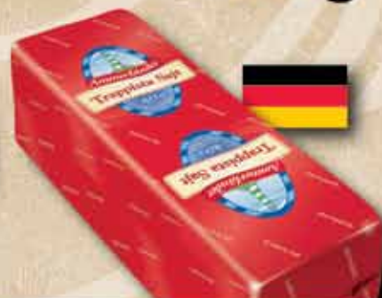
BOMBA AKCIÓ! Ammerland Trappista sajt 999 ft/kg

Nyitva tartás: Hétfőtől szombatig 10-20 óráig, Vasárnap 10-17 óráig