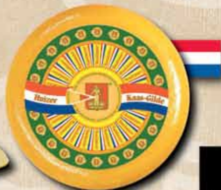
Eredeti holland Maasdamer sajt 1999 ft/kg