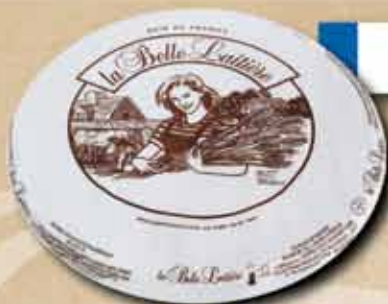
Eredeti francia Brie Belle Laitiere 1999 ft/kg