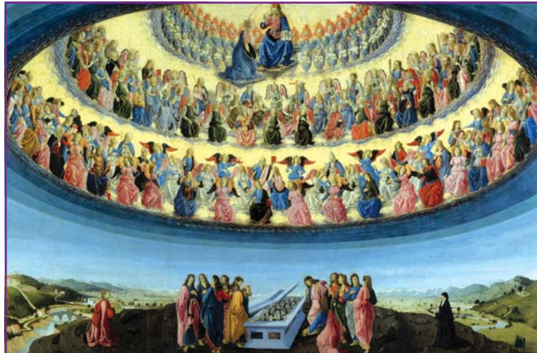
Francesco Botticini: Mária mennybevétele

Magyarországon Szent István király avatja ünnepé augusztus 15-ét. Az államalapító király élete vége felé erre a napra hívta össze Fehérvárra a királyi tanácsot, tartott törvénykezést, és ajánlotta fel az országot Szűz Máriának. A maga nemében páratlan felajánlás nyomán a közjogban is érvényesült a magyar történelem folyamán a Regnum Marianum eszme, mely szerint Magyarország Mária országa. Az Árpád-korban Szűz Mária lett a magyarok legfőbb oltalma, templomok, székesegyházak, mo-