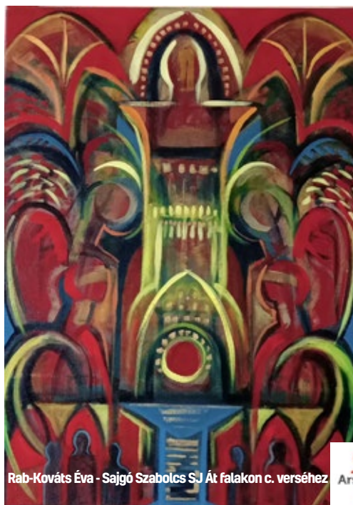
Rab-Kováts Éva - Sajgó Szabolcs SJ Át falakon c. verséhez

Szeptember 14. vasárnap 10.00 Bútorfestő workshop