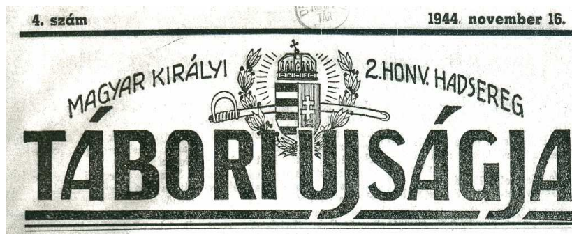
magyar királyi 2. honvéd hadsereg Tábori Újságja

A magyar királyi 2. honvéd hadsereg Tábori Újságja 1944-ben Pécsen jelent meg A/4-es méretben, 8 oldal terjedelemben, a m. kir. 2. honvéd hadsereg