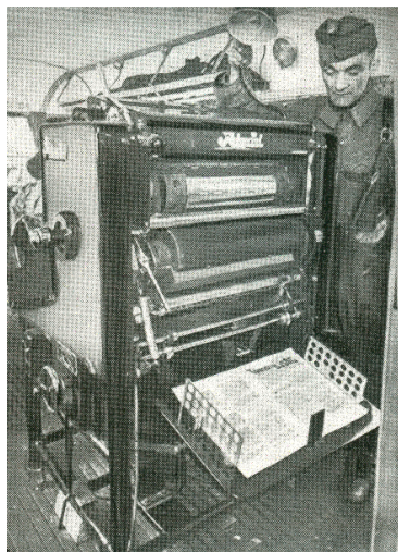
A Tábori Ujság nyomdagépe