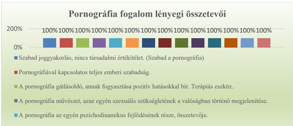
1. grafikon: A pornográfia fogalom lényegi összetevői (Készítette: Dr. Kovács István PhD)

Elsőként a pornográfia fogalom három ideológiai területe által határolt összetevők elemzését hajtottam végre, amelyet az alábbi grafikon illusztrál: