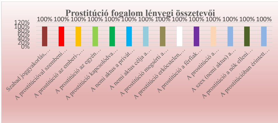
3. grafikon: A prostitúció fogalom lényegi összetevői (Készítette: Dr. Kovács István PhD)

Ugyan ezt a vizsgálati metódust követve a prostitúcióval kapcsolatos fogalmak három idevágó szemléletének az elemzését hajtottam végre. Tekintettel arra, hogy a fogalmat befolyásoló ideológiák közül a feminista, valamint a liberális szemlélet adott volt, már csak a morális nézet parallel ideológiáját, vagy ahhoz nagy mértékben hasonló szemlélet azonosítására volt szükségem. Tekintettel arra, hogy a moralista szemlélet összetevői leginkább a prostitúciós vallási ideológiára jellemzők, ezért a választás e szemlélet elemzésére és értékelésére esett. A három ideológiai terület által határolt összetevőket az alábbi grafikon vonultatja fel: