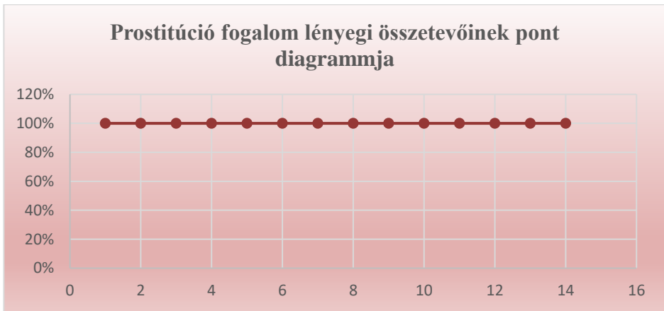
4. grafikon: A prostitúció fogalom lényegi összetevőinek pont diagrammja (Készítette: Dr. Kovács István PhD)

Ha a fentieket a korrelációs számításhoz használt függvényekkel kívánjuk ábrázolni, akkor a 100 %-os gyakorisági arányszámok miatt, minden kategória egy értéksíkon mozog, így lineáris, stagnáló függvényt kapunk, csakúgy, mint a pornográfia fogalom során. A számadatokat vonal, és pont diagram segítségével szemléltetem: