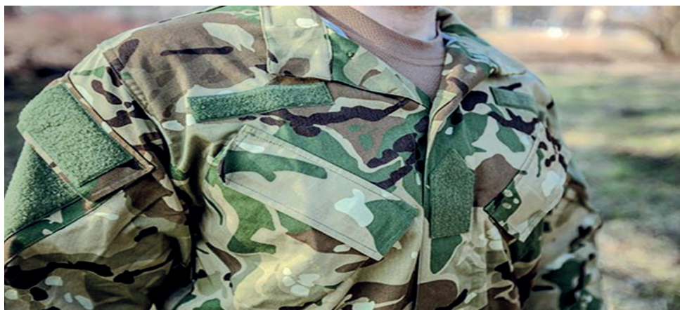
1. ábra: 15M kiképzési zubbony

Látható, hogy a 15M kiképzési gyakorló 65%-ban pamut és 35%-ban poliészter nyersanyag-összetétellel rendelkezik. A megváltoztatott textilalanyag azonban már nem lángálló, nincs ellátva rovarvédőszerrel és nem antisztatikus. A sávolykötés-kialakítás miatt ráadásul a gyakorló kisebb szakító- és tépőerőnek képes ellenállni. Gyakorlatilag ez azt jelenti, hogy a szakítószilárdsági tulajdonság kisebb mértékben gátolja meg a repedés bekövetkeztét, és ezzel összefüggésben csekélyebb tépőerő szükséges a szövet továbbszakadásához is. A képességcsökkenés ellenére az előállítási költségek minimum 25%-kal mérséklődtek, így a változtatás ebből a szempontból sikeresnek mondható. A könnyebb sérülékenysége miatt a használati ideje rövidülhet (csökken a kihordási idő). Érdekessége azonban, hogy a területi sűrűségi és a kopásállósági tulajdonságai jobbak a műveleti típusénál, amihez párosul, hogy az alanyag mintázata is teljesen megegyezik vele (1. ábra).