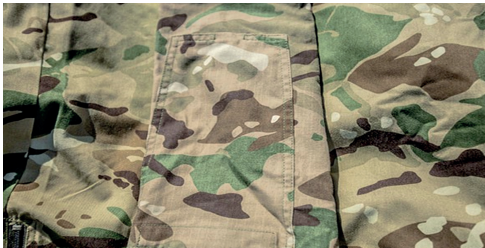
2. ábra: 15M műveleti gyakorló

Ennek ellenére a műveleti gyakorló több előnyös tulajdonsággal is rendelkezik a kiképzési változathoz képest. A korábban említett összetételnek köszönhetően a légáteresztő és olajlepergető képessége jobb, illetve az infrareflexió 8 követelményeknek is megfelel, továbbá a 2. ábra alapján az is látható, hogy a textilanyag (négyzetrácsos) ripstop (megerősített vászon) kötéssel készült, amely jobb ellenálló képességet biztosít az egyenruhának.