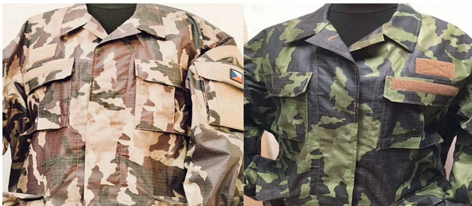
6. ábra: Az új típusú cseh gyakorló öltözet színváltó képessége

a cseh hadsereg számára, amely képes a színváltoztatásra. Ezt a textilre felvitt termokróm pigmentekkel érték el, amely környezetbarát és jó hőálló. Ennek megfelelően a sötétzöld változat 37–40 °C közötti hőmérsékleten világosabb árnyalattá alakul, amely illeszkedik a sivatagi adottságokhoz. A színek több alkalommal és hosszú távra is megváltoztathatók. Ennek megfelelően az új egyenruha képes a hőmérséklet ingadozásait figyelembe véve változtatni a színét, vagyis amikor a katonák hűvös, zord, árnyékos területen mozognak, akkor sötétzöld árnyalatot vesz fel, ha pedig melegebb és szárazabb éghajlaton hajtanak végre feladatot, akkor színei kifakulnak (6. ábra).