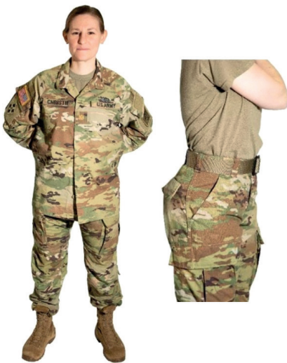
4. ábra: Az új típusú amerikai gyakorló ruházat

Az egyenruházat fejlesztésekor a környezetvédelmi szempontok érvényesítése már több külföldi ország fegyveres erőinél is megjelent. Példaként lehet említeni az Amerikai Egyesült Államok egyéni felszerelésekre vonatkozó modernizációs törekvéseit. Az új egyenruházat alapanyagának kiválasztásakor figyelembe vették az előállításból származó költségráfordítás mellett a környezetkímélő eljárások teljesülését is. Természetesen a két szemponton túl számos további műszaki követelménynek kellett megfelelnie a textilanyagoknak. Az egyenruházattal szembeni elvárásaként határozták meg a lángállósággal, a jó festhetőséggel, a megfelelő szinttartással és a rovaroknak való ellenállással kapcsolatos képességeket. Ennek alapján a gyártók az alapanyag előállításához nejlont és pamutot használtak. Majd a két nyersanyaghoz különböző környezetbarát vegyületeket keverték. A tűzzel szembeni védettség biztosítása érdekében például egy nem mérgező, foszfortartalmú anyagot, fitinsavat adtak, amely magvakból, diófélékből származik, míg a rovarriasztó tulajdonság eléréséhez (szintetikus, a környezetre nem káros) permetint keverték az alapanyaghoz. A forradalmi újításnak köszönhetően a haderő olyan felszerelést kapott, amely pozitív tulajdonságaival kedvező feltételeket nyújt a különböző műveletek végrehajtásakor, ráadásul előállítása gazdaságos, a katonák számára kényelmes, bőrbarát viseletet biztosít, amihez párosul, hogy a környezetvédelmi szempontokra is kiemelt hangsúlyt fektettek 16 (4. ábra).