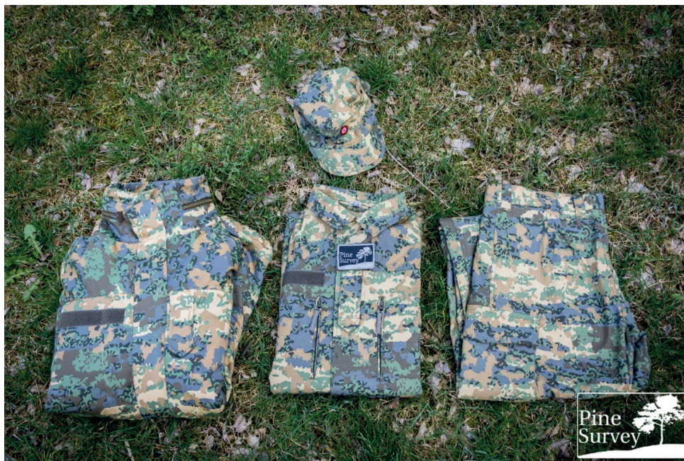
5. ábra: Az osztrák haderő „Tarnanzug Neu” gyakorlója

Az osztrák hadsereg által végrehajtott fejlesztések, bár környezetvédelmi szempontból nem olyan jelentősek, mint az amerikai haderő újításai, mégis elmondható, hogy az újrahasznosított poliészter alkalmazásával egy környezettudatosabb gyakorló öltözet sikerült előállítaniuk. A modernizáció lényege elsősorban az volt, hogy a mintázatot megváltoztassák egy különleges kamuflázs hat szín kombinációjából álló (szürke, kétféle különböző árnyalatú olíva, zuzmó zöld, khaki és homokbarna) tereptarka motívumra, amelynek célja az Ausztriában talált őshonos növényzet típusának megjelenítése. 17 Ennek megfelelően az új egyenruházat alapanyagát 67%-ban poliészterből és 33%-ban pamutból készítették, kialakítva ezáltal az előnyös tulajdonságokat biztosító ripstop szövetet. Az anyagkeverék 60 °C-on is mosható, hátránya ugyanakkor, hogy a magas poliészterarány miatt nem okoz komfortos viseletet és csökkenti a ruházat légáteresztő képességét is (5. ábra). 18