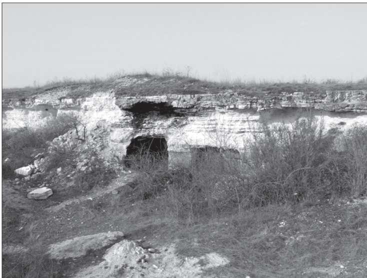
Érd, Fundoklia-völgy kőbányász-hajlék 14