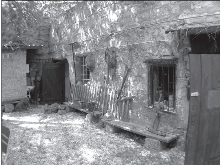
Budafoki barlanglakás a 2000-es években 12

De nem csak a főváros dél-budai területein költöznek a föld alá az emberek. A környező kisebb településeken is megjelennek a barlang- és pincelakók. Szinte minden Buda környéki településnek megvolt a maga kőbányája: Diósdon, Érden, Bián, Sósúton ugyanolyan nagy intenzitással bányászták az építkezésre alkalmas követ, mint Budafokon. Érden a ma már természeti védelem alatt álló Fundoklia-völgyben fényképfelvételek tanúsítják, hogy a kőbányászok ott a kőfejtő mellett alakították ki lakhelyüket. Diósdon a mára már helyreállított kőfejtő területén is léteztek egykor kőbe vájt barlanglakások. Törökbálinton, a Diósdra vezető út melletti egykori lovarda környezetében fekvő egykori kőfejtő függőleges falában találkozhatunk olyan helyiségekkel, melyek valamikor minden bizonnyal lakásként is szolgáltak. Sajnos ezeken a településeken ezekről az időkről és objektumokról a helybeliek ma már nem tudnak beszámolni. 13