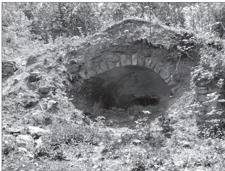
Egykori pincelakás maradványai a pátyi pinchegyen 31