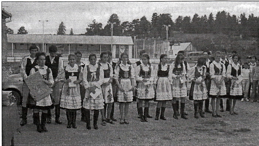
VIII. A. osztályos végzősök