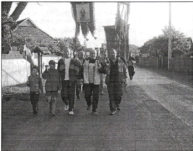
Elindultak a karcfalvi zarándokok a csíksomyói búcsúra