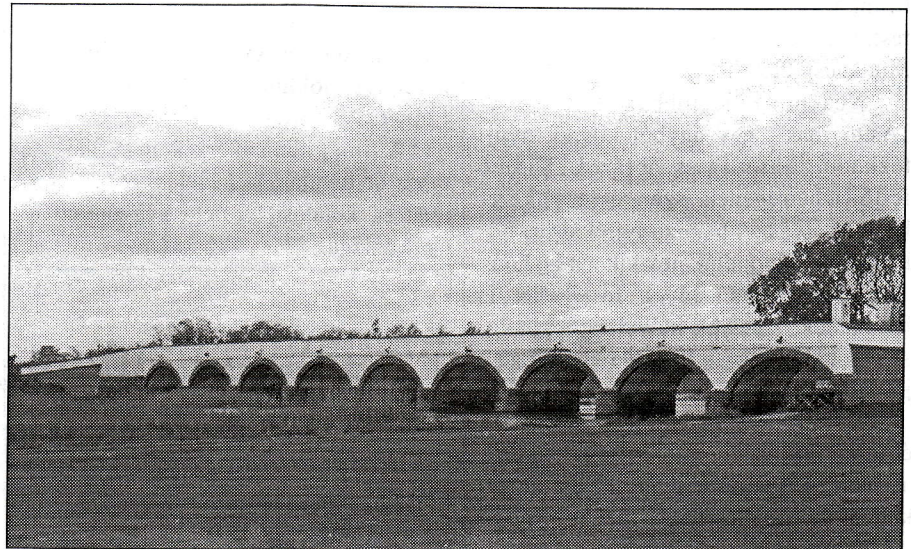
A Kilenclukú-Híd, a Hortobágyon