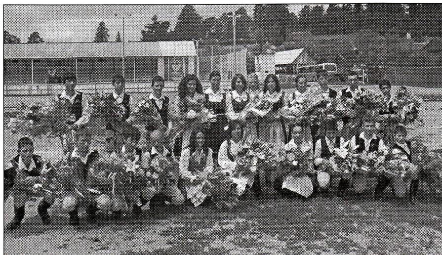
VIII. B. osztályos végzősök