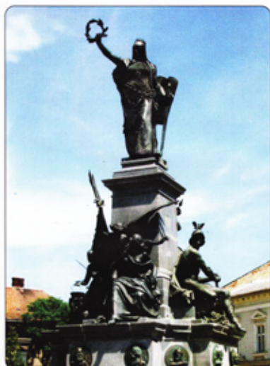
Az aradi Szabadságszobor, Zala György alkotása, 1890-ben leplezték le. Hosszú szünet (1923–2004) után, újra felállították

Független kulturális folyóirat • Megjelenik negyedévente • 2012 (XVI) XIV. évf. 3. sz. A Történelmi Magazin a Történelmünk c. folyóirat utódja