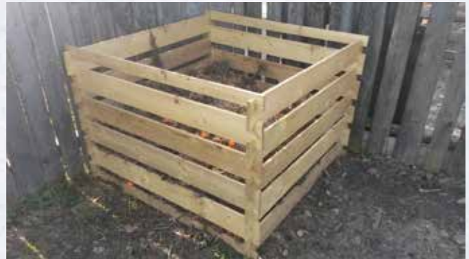
Ingyenesen igényelhető komposztláda