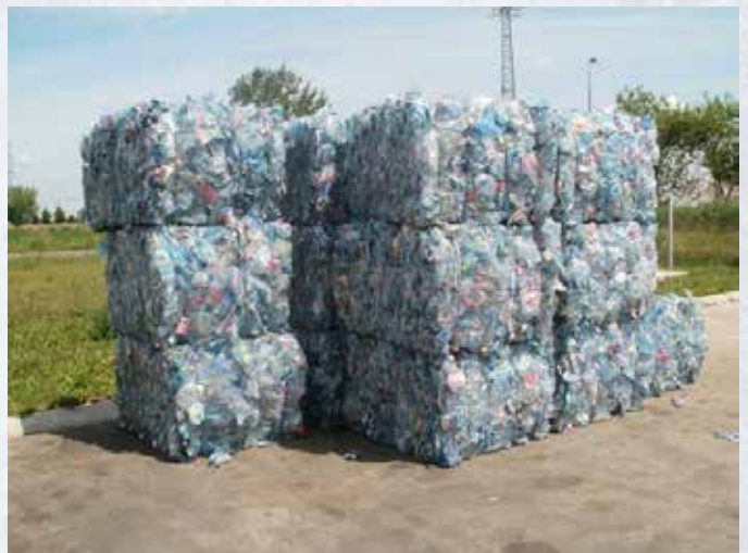
Összepréselt műanyag flakonok

Karcfalva Község Polgármesteri Hivatalának vezetősége nyomatékosan kéri a lakosságot, hogy a december 11-i parlamenti választásokon minél nagyobb számban vegyenek részt!