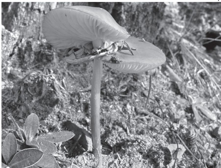
1-es számú kép

Ez a gombafaj elég ritka és rövid életű. A szerzők pont akkor és pont ott jártak, örömmel vették lencsevégre a különös formát. Tud-e valaki ennél különb véletlensorozatot?