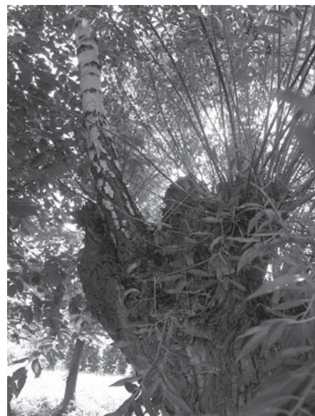
2-es számú kép

A 2-es számú kép Jenőfalván készült. Évekkel ezelőtt egy oltmenti öreg, odvas fűzfára valószínűleg a szél egy nyírfa magot sodort. Az ott kicsirázva a nedves, szerves törmelékbe gyökeret eresztett és most, mint néhány éves nyírfa díszeleg. Szó sincs a két fa szöveti összenövéséről. A nyírfa csupán élettérként használja a még élő odvas fűzfát.