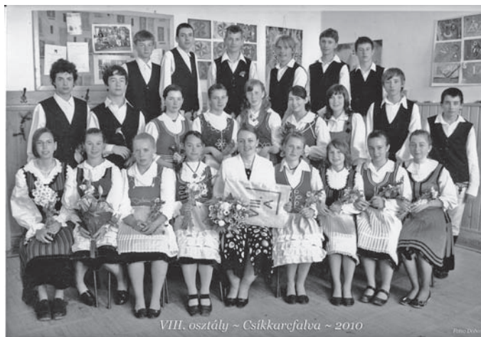
VIII. A osztály