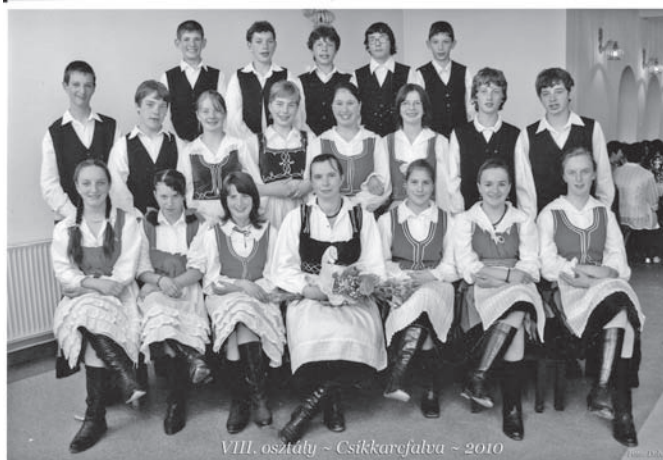
VIII. B osztály