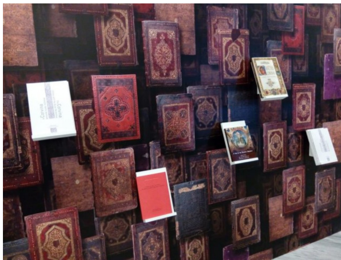
(A Közgyűlés résztvevői meglátogatták a Corvinák kiállítást az OSZK-ban. Itt készültek alábbi képeink.)

„Az én könyvtáram” projektben fejlesztett jó gyakorlatok közül kettőt bemutattak a fejlesztő-kipróbáló párosok a Hunra-közgyűlésre szervezett szakmai program keretében.