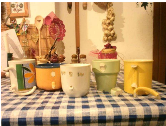
(Túrmezei Erzsébet Fületlen bögre)

Mert (csak ha így térek egyszer nyugovóra) Akkor tesz el úgy az igazságos Isten – Ahogy a bögréket rakosgattam itt lenn – A mennyei polcra nagy irgalmú szemmel Hátrafelé az én letörött fülemmel.