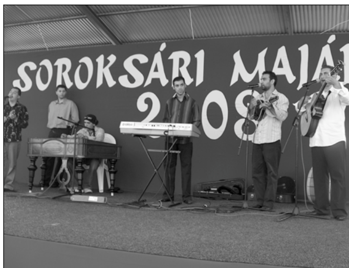
A Soroksáron működő kisebbségi önkormányzatok műsorát a Khamoro Együttes zenés, táncos műsora indította. Autentikus dallamviláguk rövid idő alatt táncra csábította a közönséget is