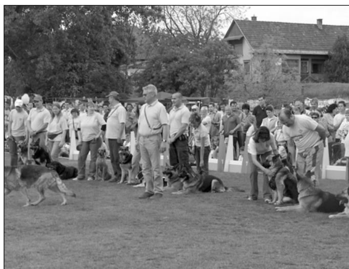
A Soroksári Kutyakiképző Iskola „növényekéi” ismét példát mutattak a fegyelmre, ügyességre, kitartásra a gazdik nem kis büszkeségére és a nézők szórakozására