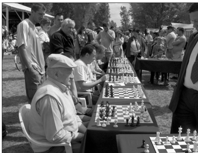
Horváth József nemzetközi sakk-nagymester 20 táblás szimultánt játszott a vállalkozó szellemű jelentkezőkkel. Ismét elmondhatjuk: „Nem a győzelem, hanem a részvétel a fontos”