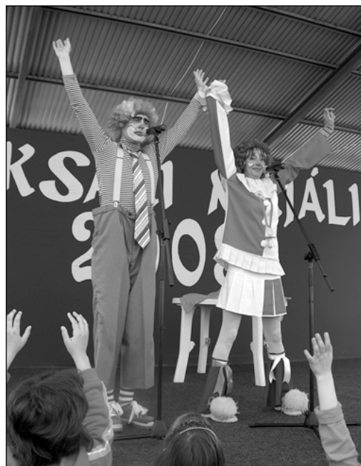
Puding és Palacsinta a két kedves bohóc minden gyermek szívébe belopta magát vidám, zenés programjával