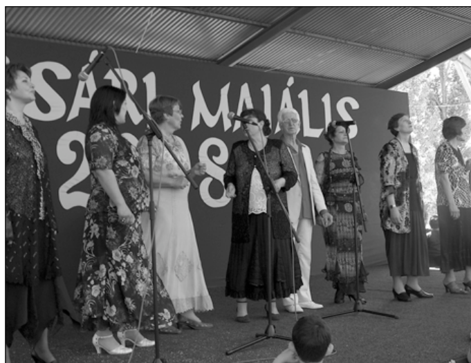
„Nem csak a húszéveseké a világ”. Akár ez is lehetett volna a címe a bolgár testvérvárosból, Tvardicából érkező énekegyüttes hangulatos programjának