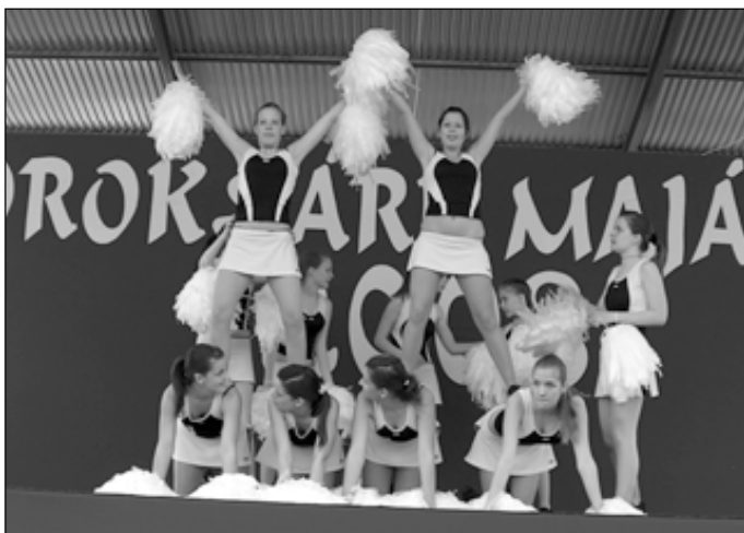
A Soroksári Tornaegyesület rutinos és utánpótlás aerobikосai nemcsak a büszke szülőket, hanem minden érdeklődőt elbűvöltek látványos és dinamikus műsorukkal