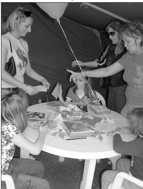
Ebben az évben a Napsugár Óvoda pedagógusai szórakoztatták és foglalkoztatták a gyerekeket. Sok szép festett kendő készült az édesanyáknak