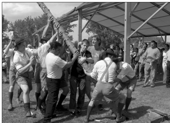
2008-ban sem maradt el a májusfa felállítása, mely a Soroksári Vidám Favágók izmos tagjainak volt köszönhető