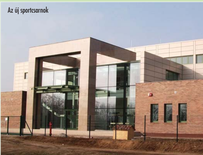
Az új sportcsarnok

Miután a külső létesítmények elkészültek, megkezdődhet a szakhatósági hozzájárulások, átadások bonyolítása, a használatbavételi engedély megszerzése. Az építésügyi hatóság által lefolytatott használatbavételi-engedélyezési eljárás befejezését követően, 2010. május végére várható a Kulturális- Szabadidő- és Sportcentrum megnyitása.