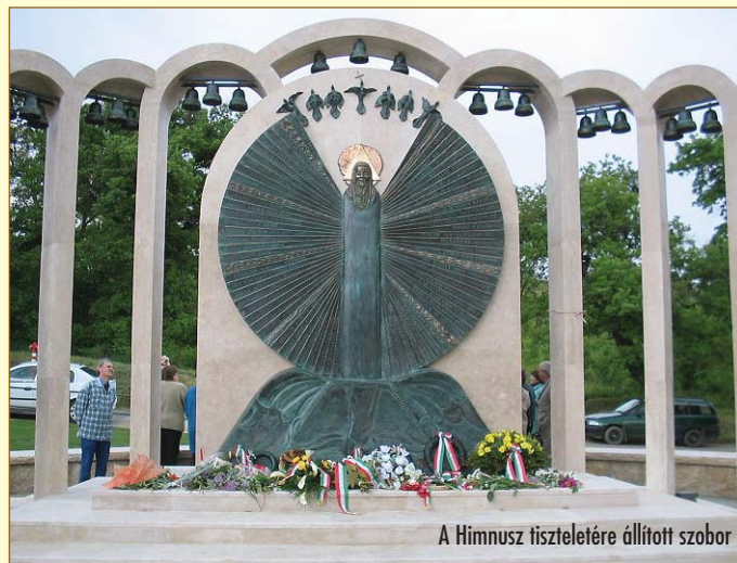
A Hymnus tisztelésére állított szobor

1919-ben a Tanácsköztársaság idején tiltott, 1949 táján pedig a megtúrt kategóriába került, a magyar nép szívéből kitepni mégsem lehetett. Mindenkinek vannak emlékezetes élményei a magyarság összetartozását jelentő Hymnusszal kapcsolatban. 1848 és 1956 forradalmában és szabadságharcában a hitbeli megújulni akarás jelképe volt a Hymnus vállalása, éneklése. Sokan emlékeznek arra, amikor 1956 októberében a Hősök terén fáklaként égtek a hazugságot terjesztő Szabad Nép lapszámjai és az emberek szívszorító áhitattal énekeltek a Hymnust. Számtalan egyéni és közösségi élmény, emlék bizonyítja, hogy Kölcsey Ferenc költeményét Erkel Ferenc zenéjével a magyar nép akarata avatta nemzeti himnusszá. A Hymnus elsőszámú fenséges és szakrális alkotás: nemzeti imádságunk, hivatalos állami Himnuszunk.