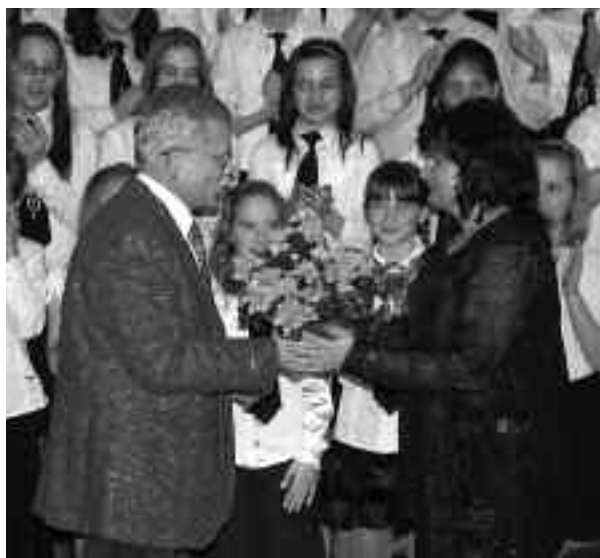
Az eseményen részt vett, és a kórusokat köszöntötte Egresi Antal alpolgármester

2011. március 9-én ismét megtelt a Soroksári Táncsics Mihály Művelődési Ház a kerület iskoláinak „aranytorkú” gyermekeivel, valamint karvezetőkkel, pedagógusokkal, szülőkkel és sok-sok érdeklődővel. A Soroksári Egységes Pedagógiai Intézmény a hagyományokhoz híven ismét megrendezte az „Éneklő Ifjúság” gálaműsort. Az énekkarok színvonalas műsorral örvendeztettek meg minket.