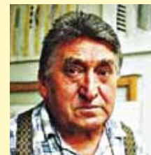
Bartl József Munkácsy-díjas festőművész

80. születésnapja alkalmából rendezett jubileumi kiállítás október 6-ig, szerdától-péntekig 14-18 óráig tekinthető meg.