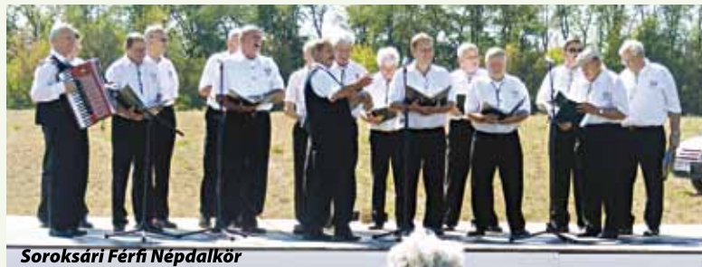
Soroksári Férfi Népdalkör