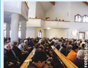
A templom kazettáján – balra fent – a mozaikkészítő ceruzás vázlatot készítette: oda kerülne a mozaikkép

Az újtelepi Szent István plébánia folyamatosan bővül. A közeljövőben készül el egy szárny a parókia mellett, így alkalmassá válik arra, hogy zárandokokat, hívőket fogadjon akár több napra is, és ugyanitt lelki gyakorlatokat lehessen végezni.