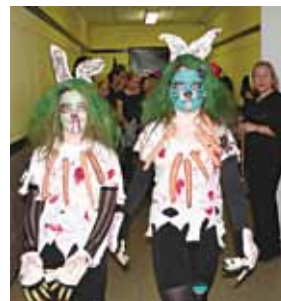
Az angoltanárok szervezték a halloween partyt

A nyolcadikosok horrorkamrát készítettek, ahol sötétben, különböző akadályok, ragacsok közt kellett végigmenni, mindenféle furcsa hangok kíséretében.