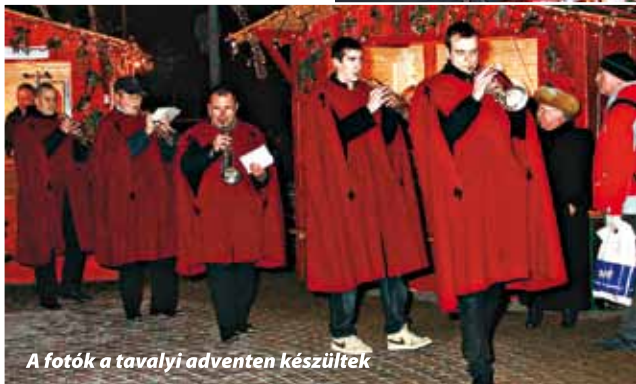
A fotók a tavalyi adventen készültek