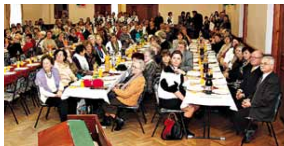
Idén 210 meghívót küldtek el, körülbelül 130 vendég érkezett

A műsorban a tavalyi Kiscsillag verseny arany fokozatú győztesei léptek fel. Énekeltek a Soroksári Pedagógus Kórus,