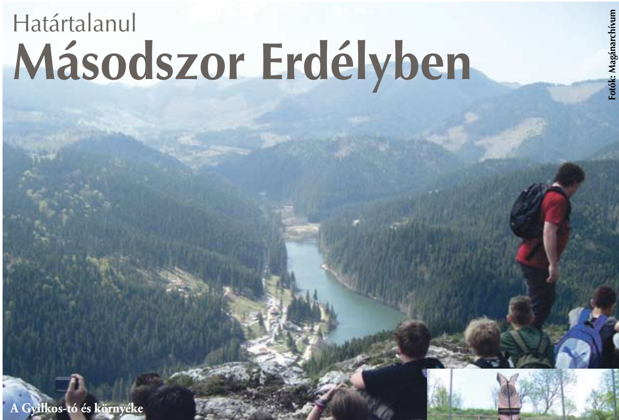
A Gyilkos-tó és környéke

Április 29-e és május 3-a között a Török Flóris Általános Iskola 7. évfolyamos tanulóit a Határtalanul pályázat keretében Erdélybe kirándultak. Az idei tanévben a diákok útja Nagykárolytól indult és a második nap este eljutottak a Gyilkos-tóig. Ez az út kb. 2000 km hosszú oda-vissza. Kolozsvárot és a Gyilkos-tónál szálltak meg. A szálláshelyeket és a buszköltséget a Bethlen Gábor Alapkezelő Zrt. finanszírozta.