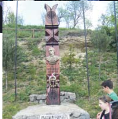
Vasvári Pál emlékműve

A tordai sóbánya elvárásolta tanulóinkat. A körösfői templomban énekeltek, utána pedig megkoszorúztuk