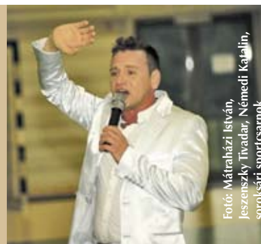
Foto: Mátraházi István, Jeszenszky Tivadar, Némédi Katalin, soroksári sportcsarnok