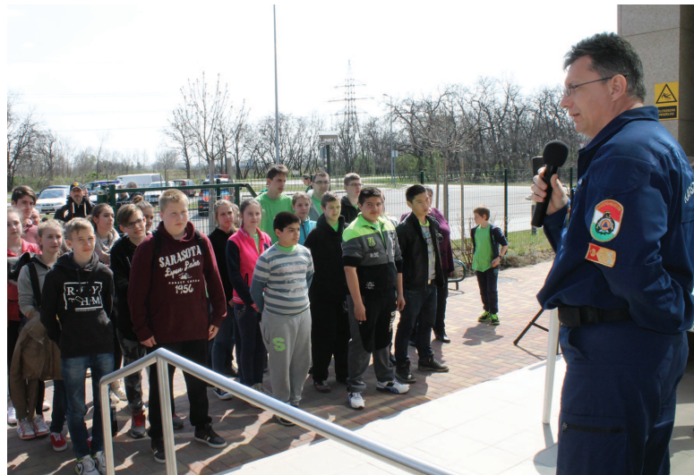
A szervezők biztosítottak mindenkit, hogy jövőre is lesz verseny, melyre várják a kerületi diákokat

Április 22-én az óbudai Hajógyári-szigeti Székér csárda területén rendezik meg a fővárosi fordulót, melynek győztesei az országos versenyen mérik össze tudásukat.