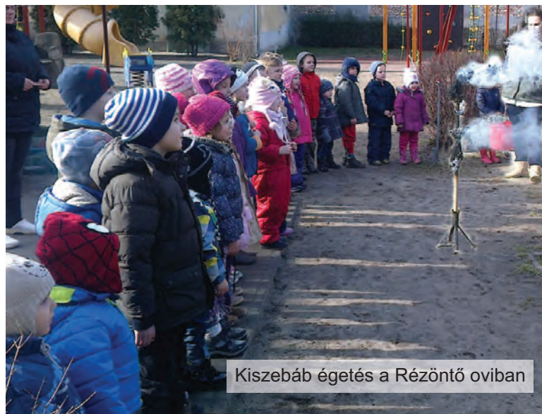
Kiszebáb égetés a Rézöntő oviban