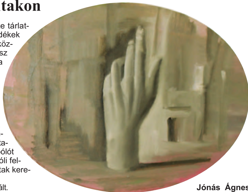
Jónás Ágnes

A tárlat április 1-jéig látogatható, szerdától péntekig 14 és 18 óra között.