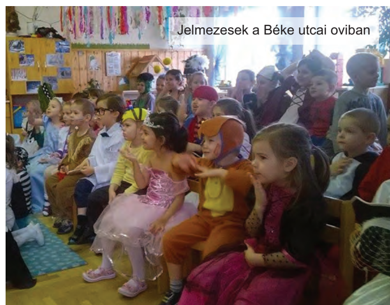
Jelmezesek a Béke utcai oviban