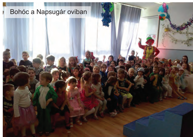
Bohóc a Napsugár oviban