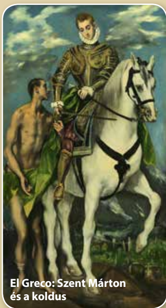
El Greco: Szent Márton és a koldus

Márton-napi lakoma: November 11-e a téli évnegyed kezdő napja, mikorra az újbor elkészült és a termésből is maradt még. A rómaiak Aesculapiust, az orvosistent ünnepezték ilyen