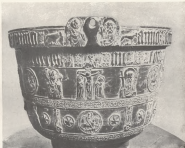
Fig. 5. Ruszkin (Ungheria settentrionale). Giovanni delle Bombarde senior, Fonte battesimale.