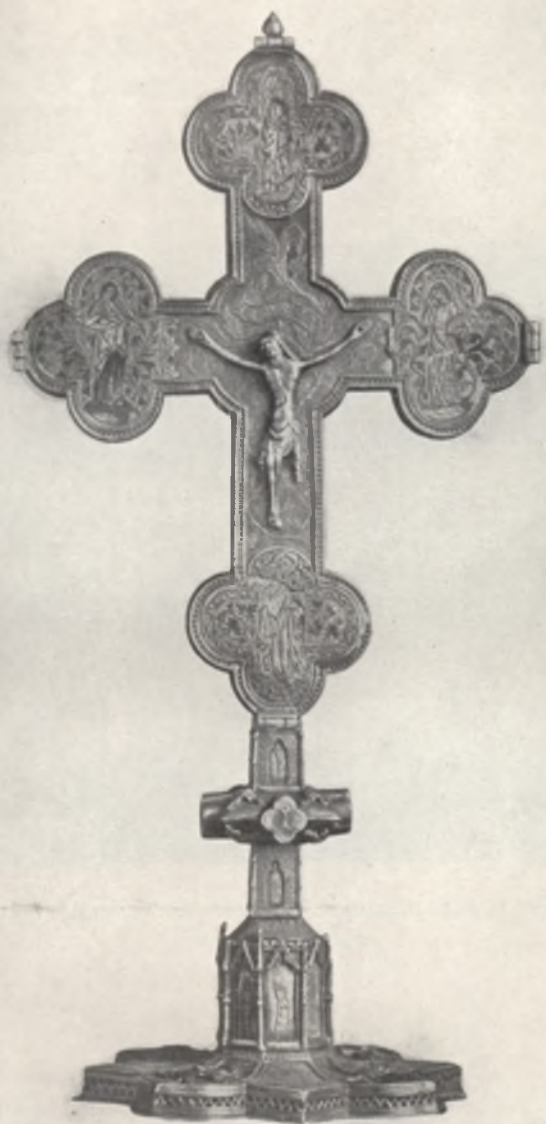
Fig. 4. Igló (Ungheria settentrionale)-Chiesa parrocchiale. Nicola Gallico (Nicola di Simone di Siena), Pacificale.