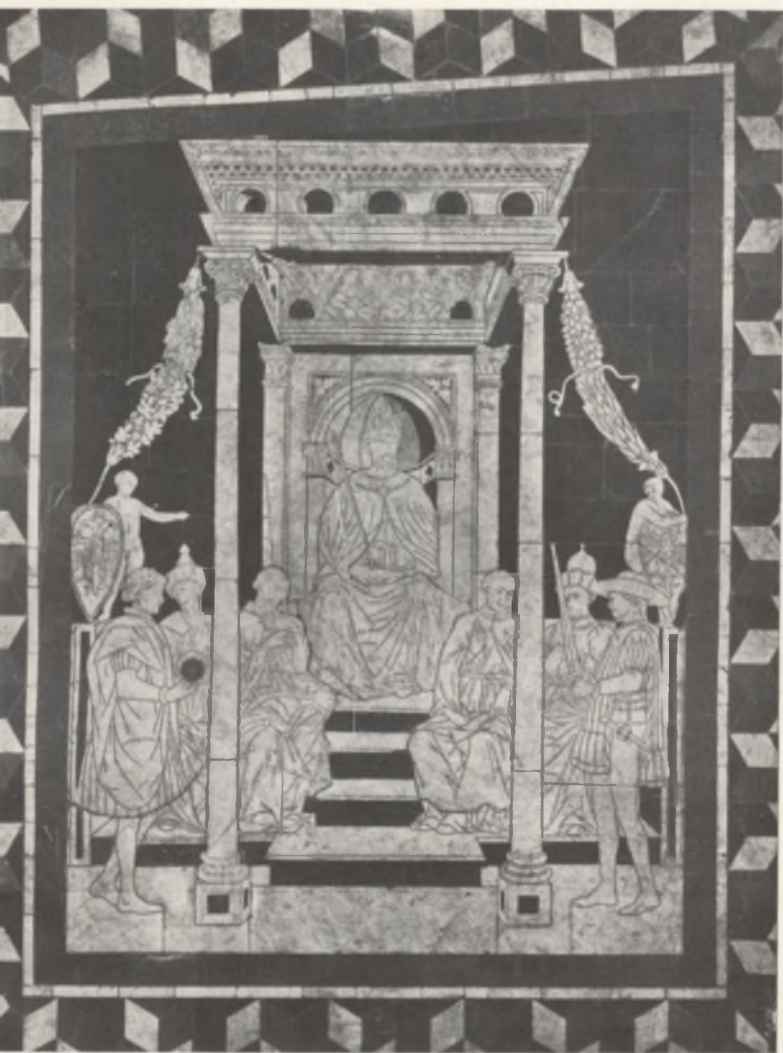
Fig. 3. Siena-Cattedrale. Mosaico rappresentante l'imperatore Sigismondo di Lussemburgo, Re d'Ungheria, in mezzo ai grandi del regno.