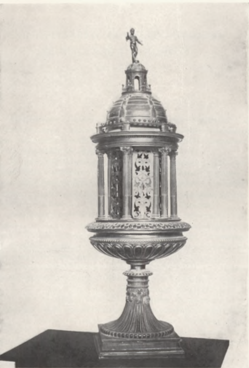
Fig. 6. Siena-Chiesa di Santa Maria di Fontegiusta. Giovanni delle Bombarde junior, Ciborio.