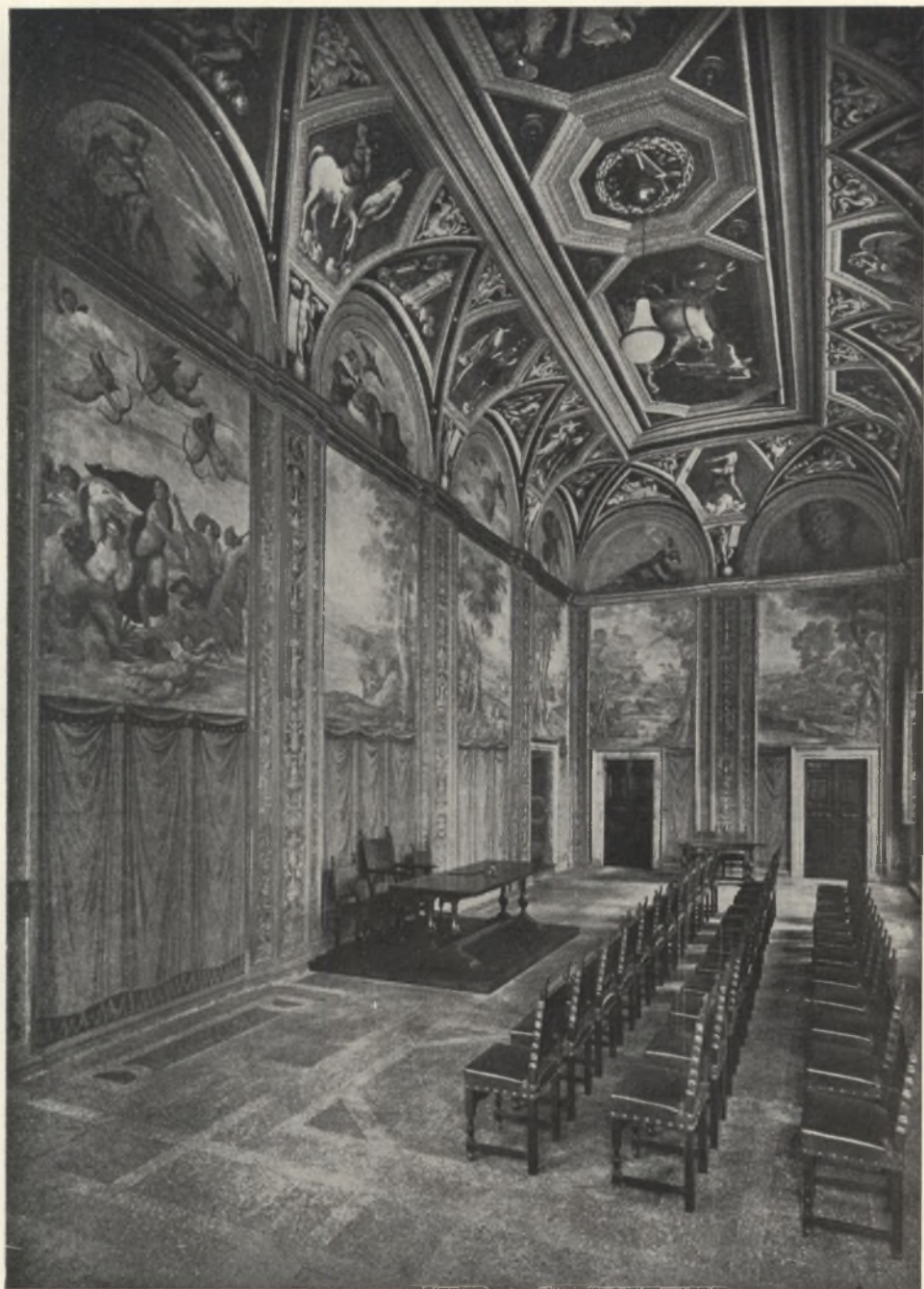
La «Farnesina»: Sala di Galatea.