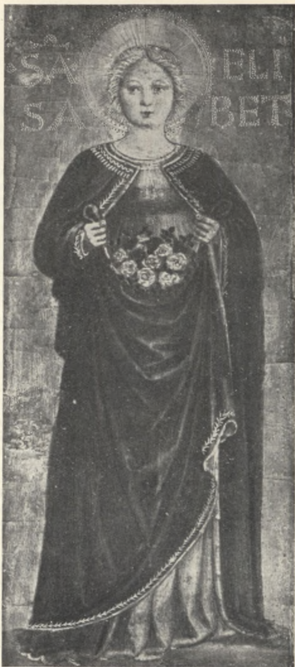
Benozzo Gozzoli. S. Elisabetta d'Ungheria. Dettaglio della Vergine col Bambino benedicente. Perugia, Pinacoteca.