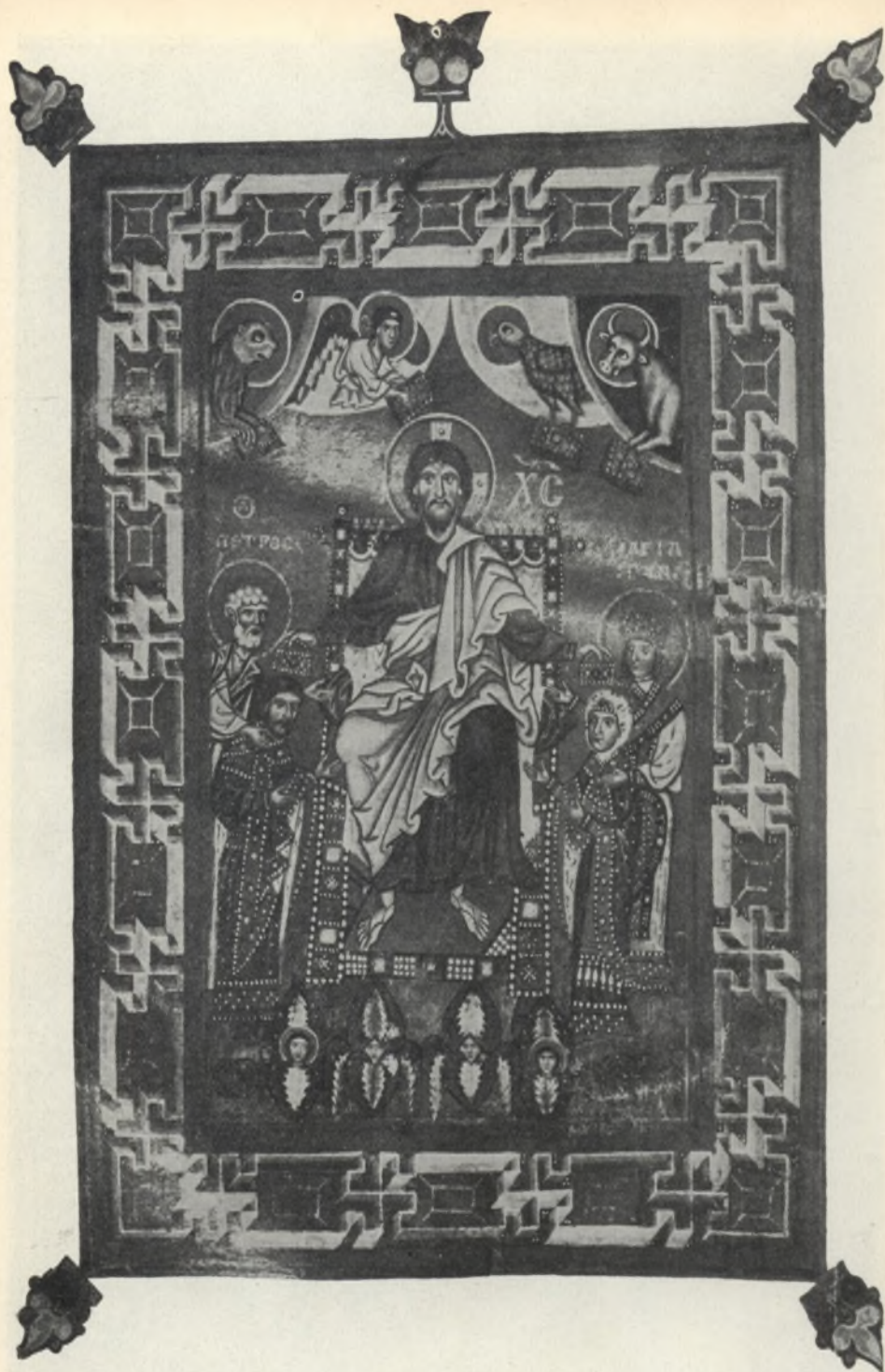
Fig. 4. Salterio della regina Gertrude. Cristo incorona i principi russi Jeropok ed Irene. Cividale, Museo civico.