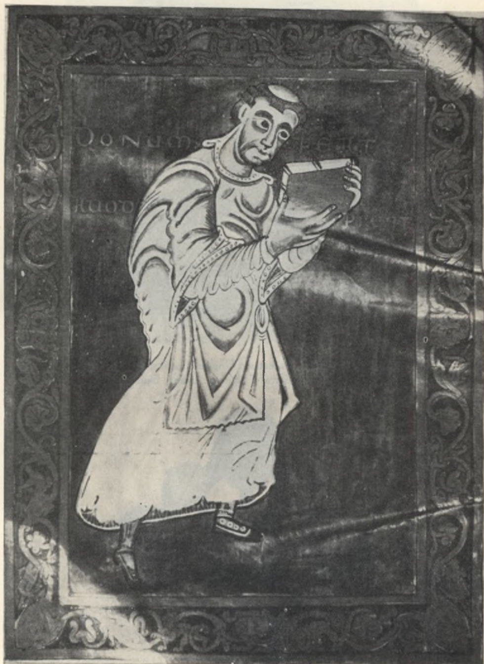
Fig. 3. Salterio della regina Gertrude. Figura del donatore, il monaco Ruodprecht. Cividale, Museo civico.