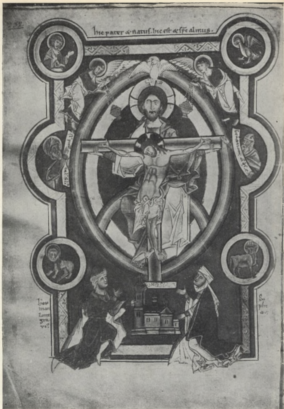
Fig. 7. Libro di devozione di S. Elisabetta d'Ungheria. La Trinità con le figure dei suoceri della Santa. Cividale, Museo civico.