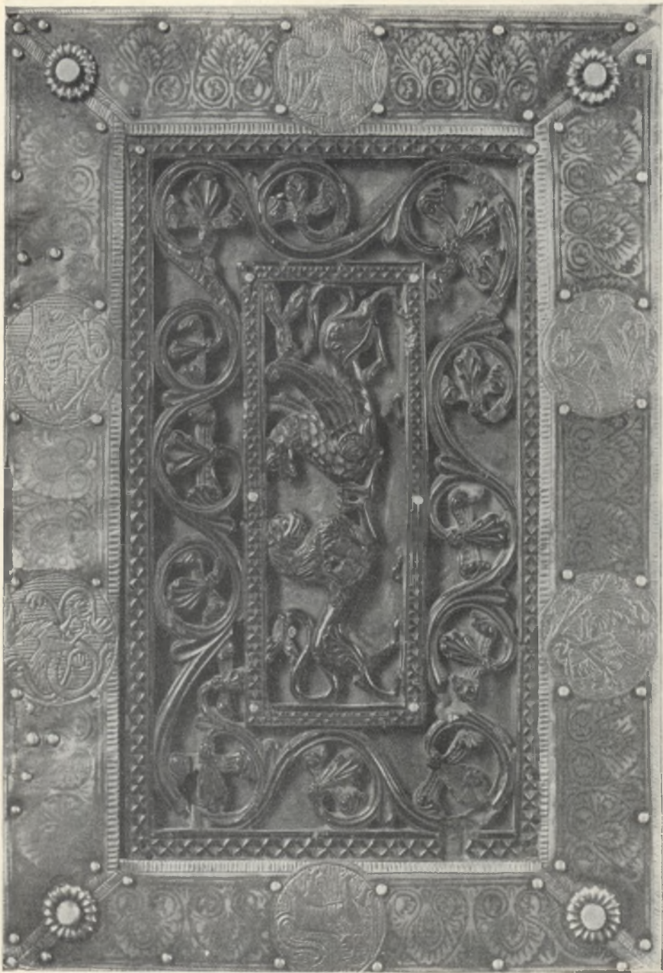
Fig. 6. Libro di devozione di S. Elisabetta d'Ungheria. Asse di copertura (parte posteriore). Cividale, Museo civico.