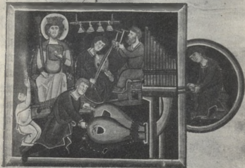
Fig. 8. Libro di devozione di S. Elisabetta d'Ungheria. Una miniatura del codice. Cividale, Museo civico.

date eum infirmamento uirtutis eius. Laudate eum in uirtutibus eius laudate eum secundum multitudinem magnitudinis eius. Laudate eum in sono tube laudate eum in psalterio & cythara. Laudate eum in tympano & choro laudate eum in chor- ois & organo. Laudate eum in cymbalis bene sonantibus laudate eum in cymbalis tubilationis omnis spiritus laudet dominum.