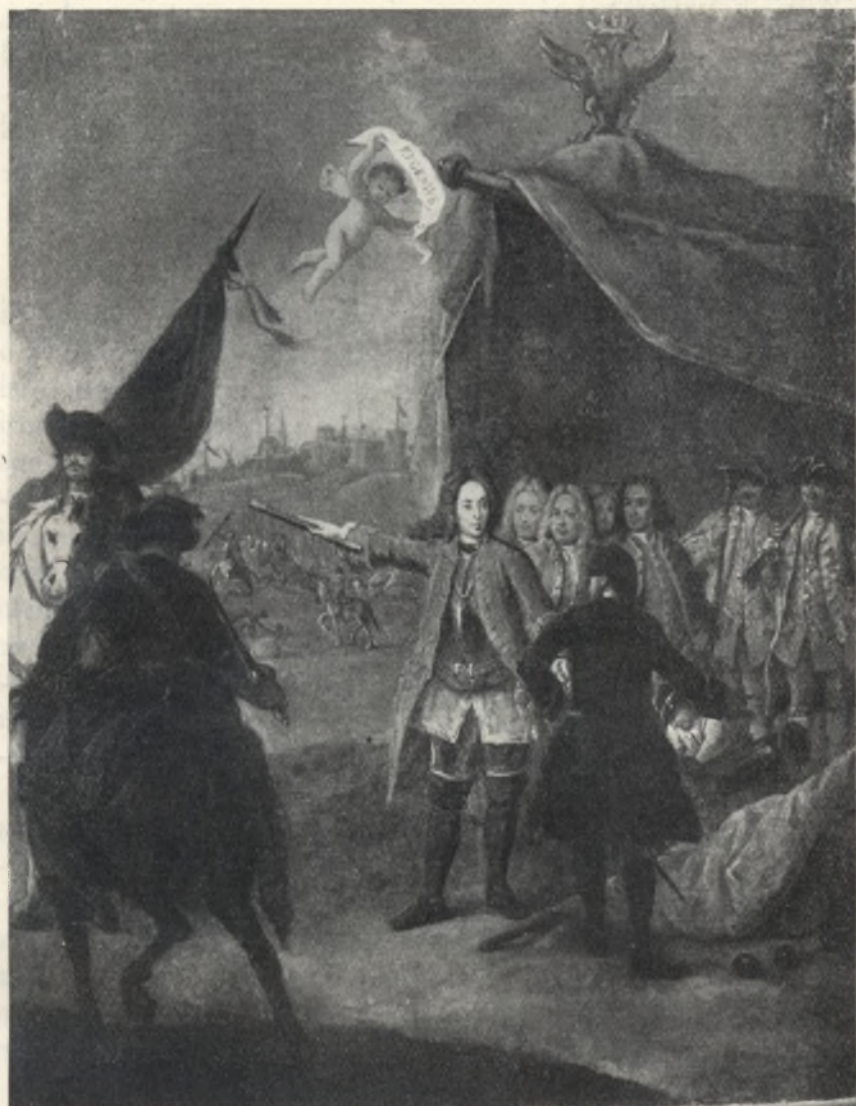
Fig. 1. Pietro Longhi: Il Principe Eugenio di Savoia. (Venezia. Ca' Rezzonico.)