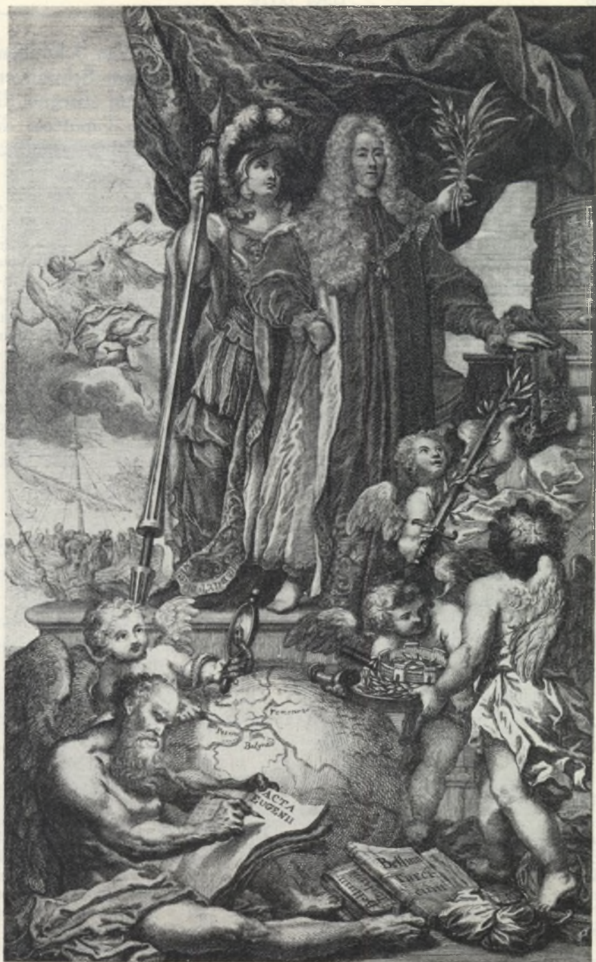
Fig. 6. Incisione in rame di J. A. Schmutzer (Schmuzer), dal disegno di N. B. Belau. (No. 18.)