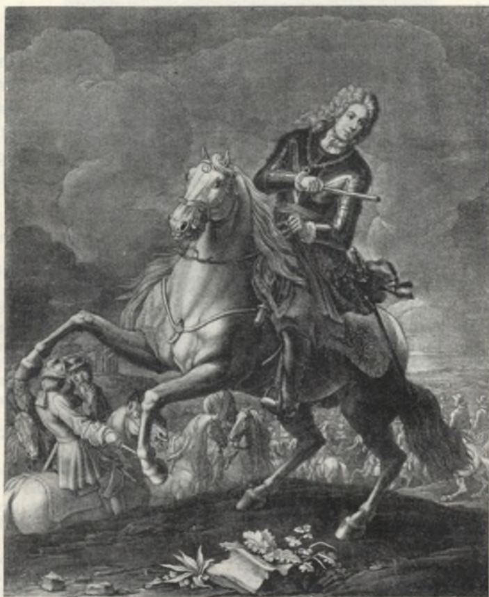
Fig. 8. Mezzotinto di G. P. Rugendas. (No. 25.)

24. Incisione in rame. 140×83 mm. Fondo quadrato, medaglione ovale; nello spazio tra cornice e medaglione, dietro tenda rialzata, il medaglione contenente il ritratto incorniciato d'alloro, è nelle mani di Ercole che