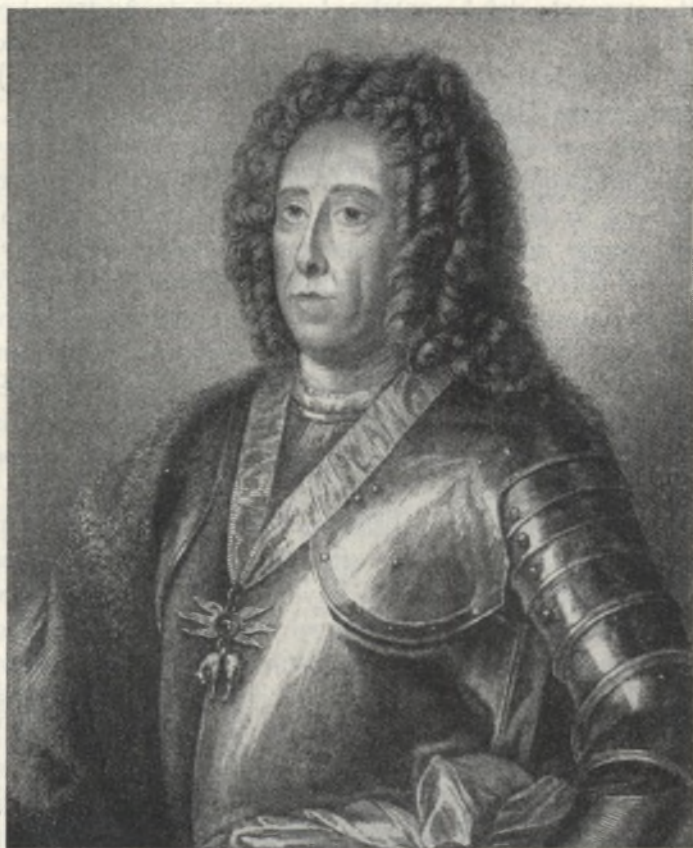
Fig. 3. Incisione in rame di A. Marcenay de Ghuy, dal ritratto dipinto da G. Kupetzky. (No. 6.)

Vogel (1683—1737). La prima copia è senza data, la seconda è uscita come un foglio della seconda parte dell'opera intitolata «Joannis Kupezky, Incomparabilis Artificis, Imagines et Picturae quotquot earum haberi potuerunt, antea ad quinque Dodecades