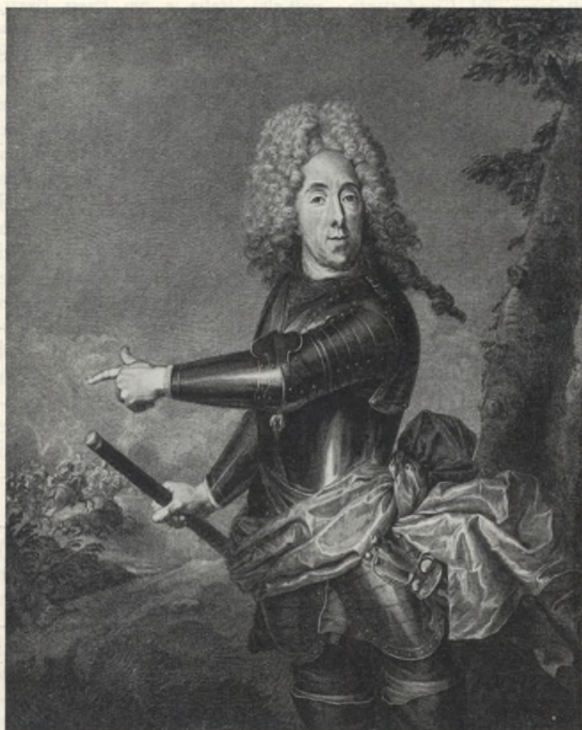
Fig. 4. Incisione in rame di B. Picart, dal ritratto dipinto da J. Van Schuppen. (No. 11.)