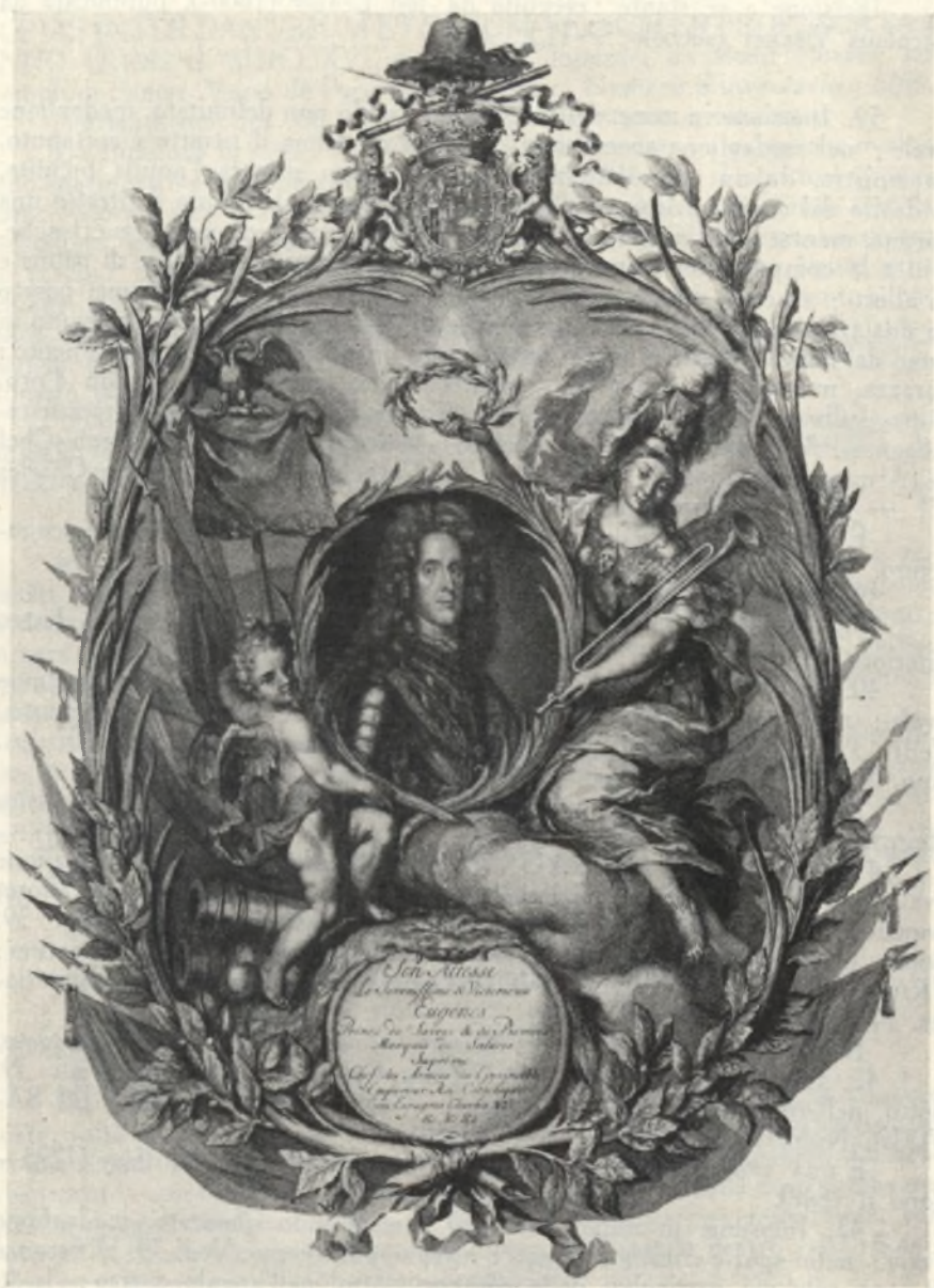
Fig. 11. Incisione in rame di autore ignoto (sec. XVIII). (No. 39.)