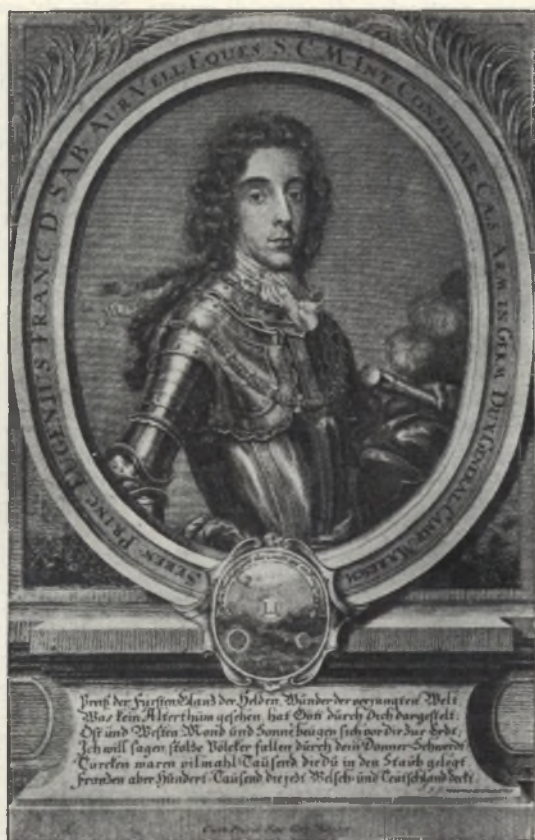
Fig. 9. Incisione in rame di J. J. Haack. (No. 29.)

28. Incisione in rame. 254×178 mm. Fondo quadrato, ritratto di tutta figura, seduta su cavallo bianco volto verso destra, con la testa un po' verso sinistra, con nel la destra spada sguainata. Il cavaliere sta in mezzo a piante e pietre, su una collina. Vestimento: cappello, corazza, mantello, cravatta bianca, insegne del Toson d'oro, sciarpa, pistola, pantaloni aderenti, stivaloni. Nello sfondo mischia di cavallerie. Sotto, nell'angolo destro: C. Weigel exc.