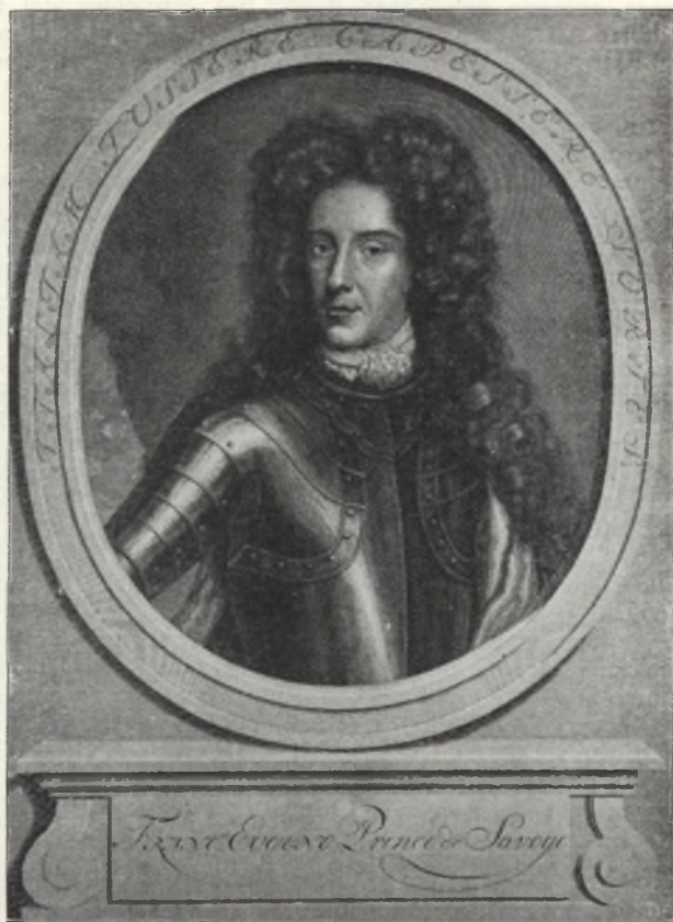
Fig. 10. Incisione in rame di autore ignoto. (sec. XVIII.) (No. 37.)

Hic ille est cujus dextra vis Turcica fracta est : — Inivium in Italiam qui patefecit iter. — Qui junctis tumidos prostravit viribus hostes, —