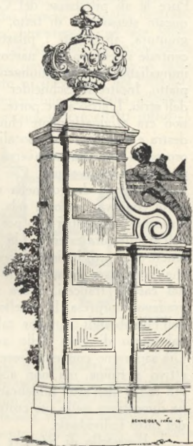
Fig. 3. Pilastro del portone del castello di Ráckeve.