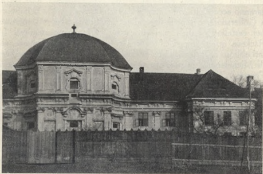
Fig. 5. Castello di Ráckeve. La facciata verso il giardino.

Questo stesso motivo torna poi, in una forma decorativa, pure nel lato verso il giardino (Fig. 5), sebbene vi sia aperta una