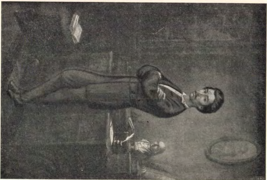
Orlay Petrich Soma: Petőfi dolgozószobájában Katalógus: 11. sz.