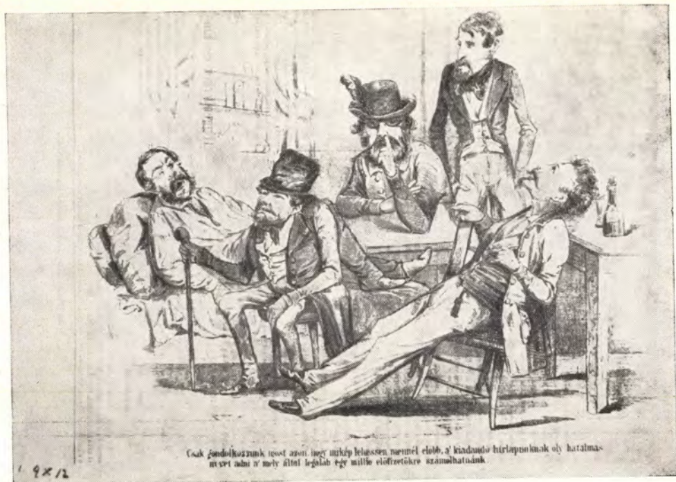
Szerelmey Miklós: Lapalapítás. Katalógus: 8. sz.