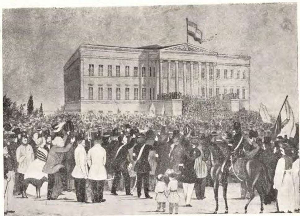
1848 március 15. Katalógus: 10. sz.