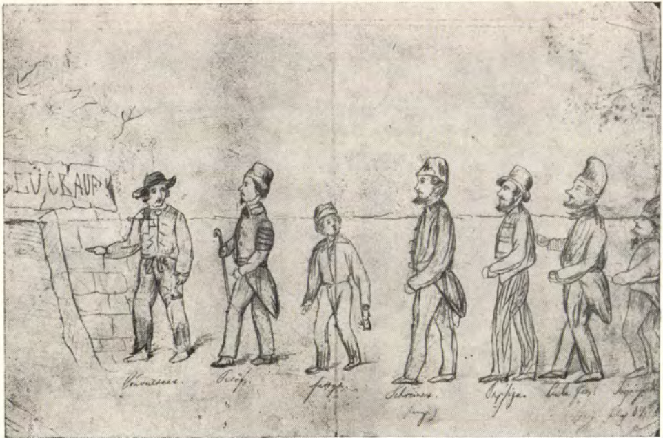
Pap Zsigmond: Petőfi a bányába megy. Katalógus: 5. sz.