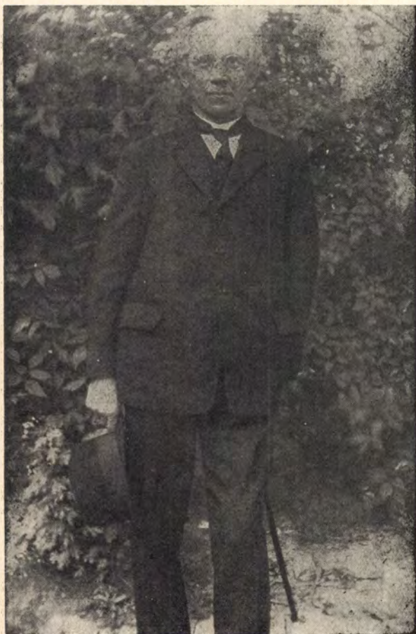
1. Osvát Ernő élete végén