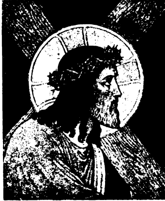
Bűnünket Ő hordozta.

Kiszámíthatatlan sok békesség származik a lopás vétségéből. Még akkor is, ha emberek nem büntetik. Pedig milyen sokszor rajtaveszt a tolvaj! Az emberek azután büntetik, szegycint hoznak rá. Itt közelünkben az egyik községben, de a szomszédosokban is sűrű egymásutánban tüntek el a hízott libák... De csirkék és másgeyebek is. Nyomozták, keresték a tolvajt. Sokáig eredménytelenül. Végre mégis utólrerte a végzet. Leleplezték. A esendörök elfogták, vallatták. Nem volt mit tagadni. Hajtották végig a falun, mikor már mindent beismert. Ezt kellett énekelnie: «Kacsamáj, libamáj...» Mit szenvedhelet csak ezalatt az egy útja alatt. És még azután, hosszú évekig, míg lassan napirendre lérték felette. De még a börtön is kijárt érte... Hát érdemes volt? Csak az emberektől kapott büntetés is mennyivel felülmúlta azt a kis előnyt, mit a lopott étel élvezete szerzelt. Hát még a bűn? ... Rossz üzlet a bűn... Isten csak úgy boesájtja meg még a gyónásban is. ha a jóvátételt ko-