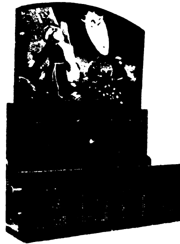
Köruis-pad a palások ideéből a sopronbártalvai templomban (XVII. sz.). Felette Szent Ferenc, amint alvernoi magányában a stigmákat kapja.

Nem mondtotta meg Dánielnek is az angyal, mikor bojttben, szákbán es hamubán imádkozott: