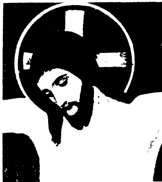
Feláldoztatott, mert őmaga akarta.

ke: „Én nemzetem... te ellened mit vétettem? Felelj meg immár énne- kem!... Egyiptomból kimentedben, nyilást tettem a tengerben, Te mel- lémet megnyitottad, piros vérem ki- ontottad. Ellenséged én megvertem, a Fáraót elvesztetted; Te ostorral testem verted, talpig vérbe elkever- ted... Én Kánaán dús földére be- vittelek, nagy bőségre; Te Golgota zord hegyére vittél engem szenvedés- re”. — Nagyon érezzük azt is, hogy ezek a panaszok nemcsak a zsidó