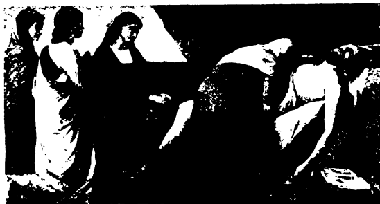
Anzelm Feurbach Pietája.

„A te hited megszabadított téged. Menj békével!”