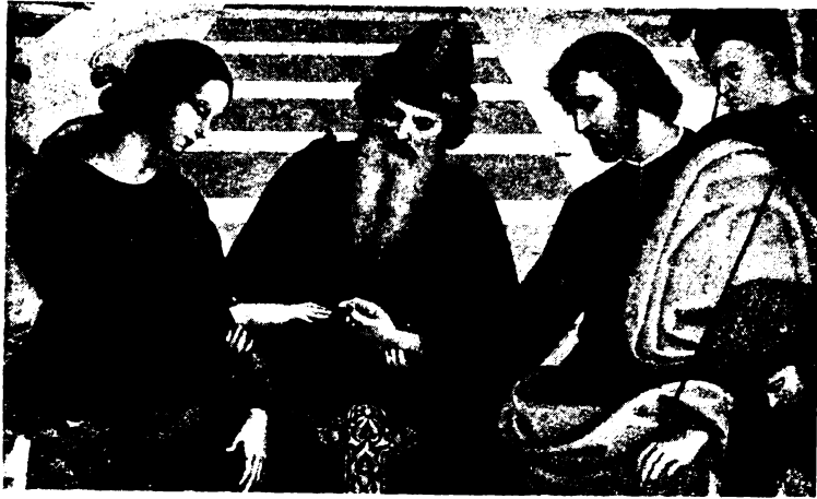
Raffaello: Szűz Mária eljegyzése Szent Józseffel.

Durva, bűnös kezünket rátettük Jézusra, s Szent Testén felfakadtak vérről folyó sebei. Ha Jézus rátette valakire a kezét, áldott, gyógyított, vagy életre hívta a holtat. Mi viszont keresztet adtunk a vállára, s Ő mégis hű maradt hozzánk. Elesett, földre nyomta a teher, de hűsége nem inogott meg. Átluggattunk kezét, de hűsége nem éithettünk csorbát. Haláiba kergettük, de kitarított mellettünk végig, míg minden be nem teljesedett. Testén semmi sem maradt épségben, de szívében a hűség, igen.