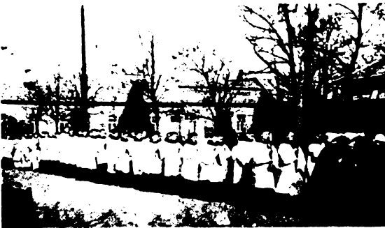
A gyöngyösi kisbarátok a körmenetben.

Istené ő. Ezért szólal meg Istene előtt napjában nyolcszor, hogy kérjen, hálát adjon, imádjon, dicsőít-