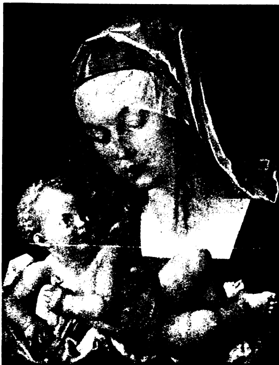
Dürer: Üdvözlégy, május hajnala!

* Ettől év minket XI. Pius pápa Rite explatis kezd. apost. körlevelében.