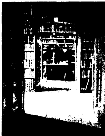
A tudomány csarnokában.