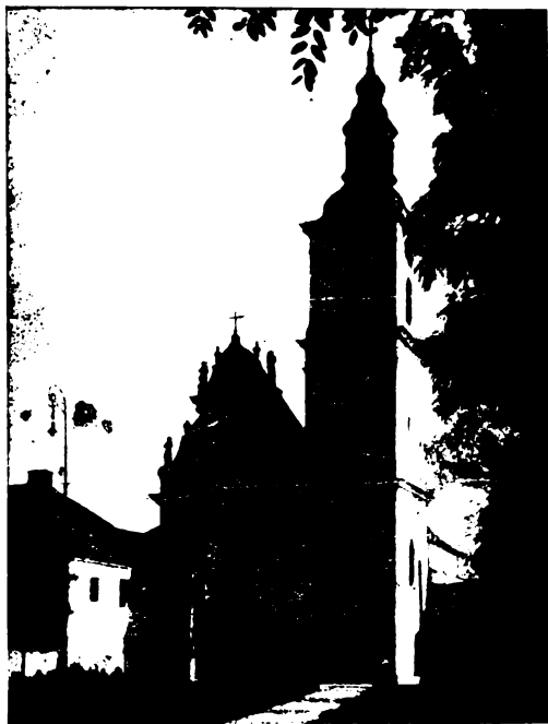
A gyöngyösi barátok temploma.

Gyöngyös város vezetősége bizonyára hálás Dezséri Bachó László alezredes irodalmi munkásságáért. Budapest kivéve alig van az országban város, melynek múltját olyan kimerítően megírták volna, mint Gyöngyös történetét. Bachó alezredes eddig nyolc kisebb-nagyobb munkát adott ki Gyöngyös múltjáról, három új műve kéziratban áll készen, hat pedig most várja a sajtó alá kerülését.