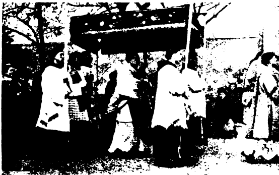
Szerpapok a Nagy Király kíséretében.

Ennek aztán gyakorlati kisugárzása van. Míg a gyümölcsfán a gyümölcs csak virág, ügylátszik, hasz-