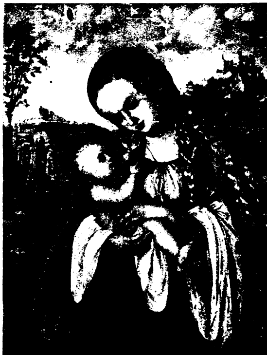
Cranack: Madonna a kis Jézussal.

A jog fejlődésének története igazolja, hogy a közfelfogás koronként és időnként változik. Tényként kell megállapítanunk, hogy az utolsó évtizedek folyamán hiányzott az egységes társadalmi felfogás, amely egyöntetű akaratot képviselt volna, és így irányítólag hatott volna az